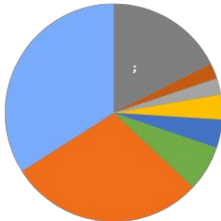
структура рынка в разрезе нпф по величине пенсионных резервов (млрд. руб.,%)