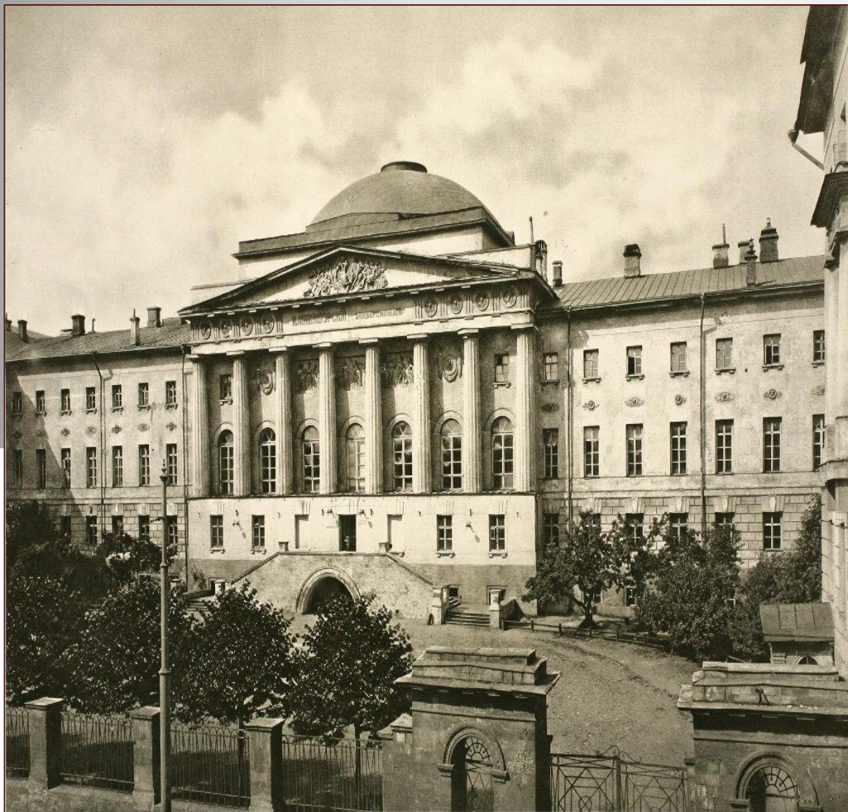
„Старое здание“ Московского Университета.