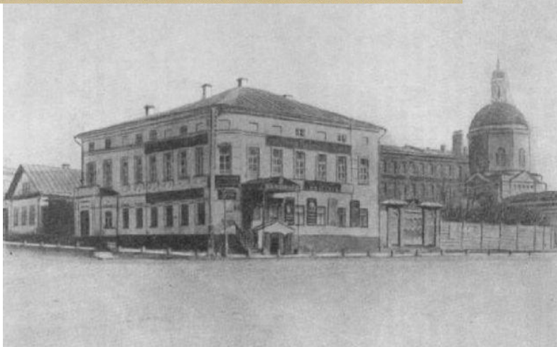
Дом в Симбирске, в котором родился И. А. Гончаров.