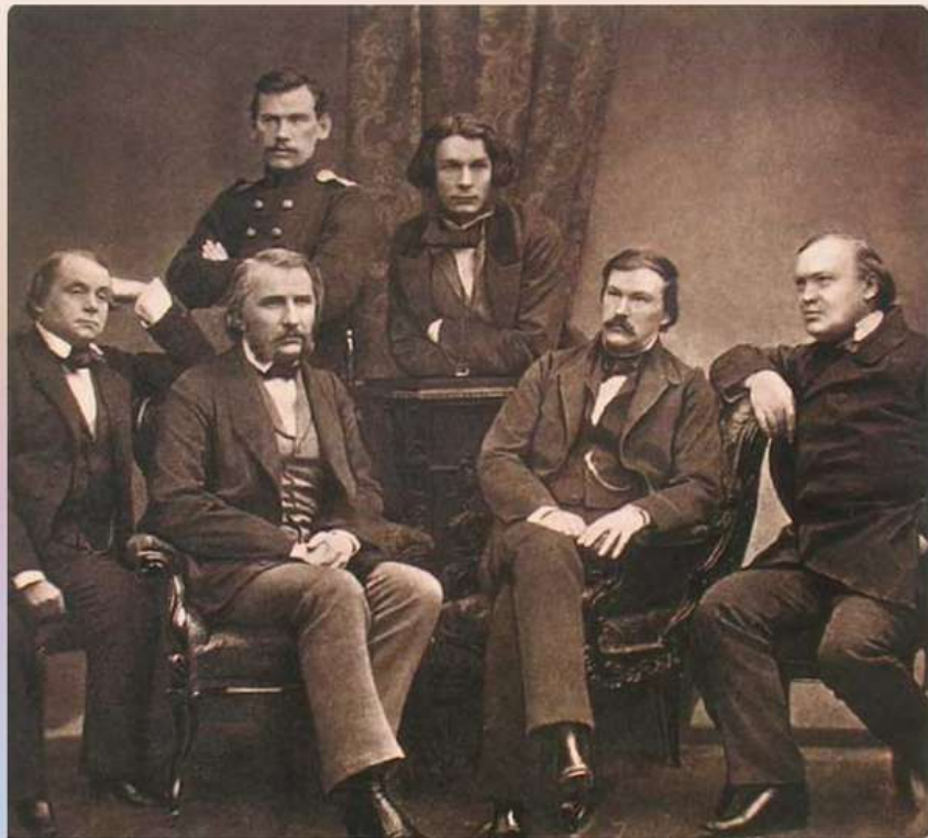
Гончаров И.А., Тургенев И.С., Дружинин А.В., Островский А.Н., Толстой Л.Н., Григорович Д.В.

1855 г. – вернувшись из круго-светного путешествия, определяется на службу в Петер- бургский цензурный комитет.