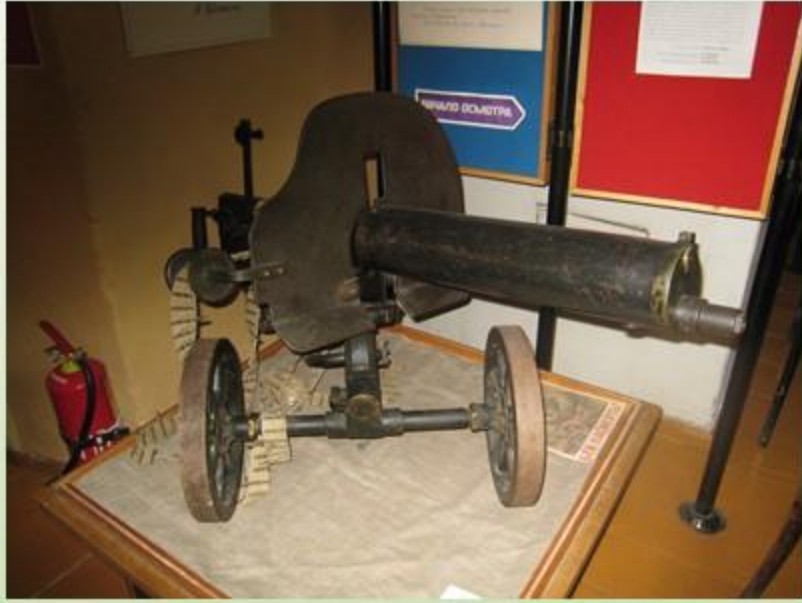
Пулемет «Максим» времен интервенции