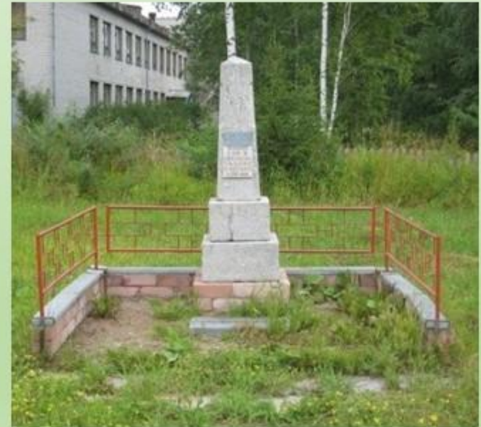
Памятник красноармейцам, сражавшимся с интервентами