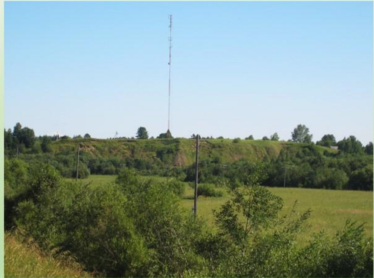
Современный вид на д. Высокая Гора со стороны р. Паденьга