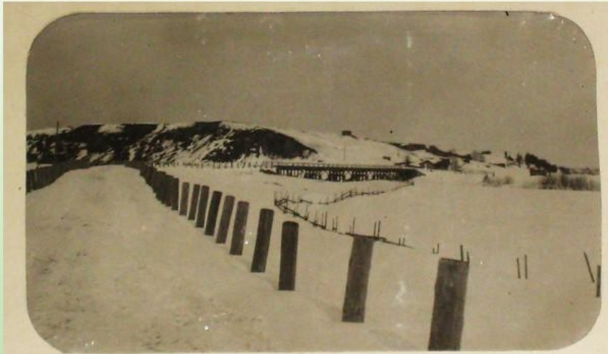
Вид на д. Высокая Гора, где находились позиции интервентов.