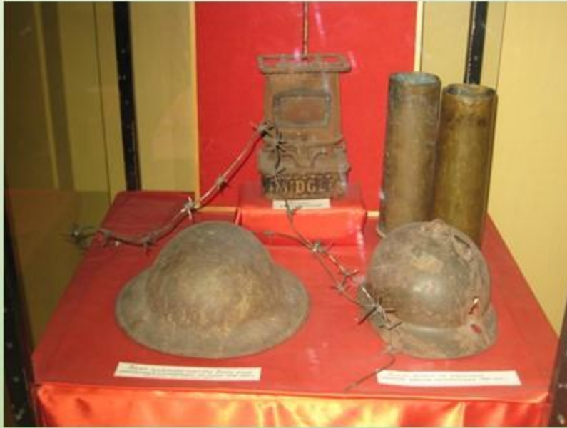
Каски солдат-интервентов, вражеские снаряды