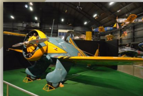
Первый металлический моноплан американских ВВС

Рузвельта, Гарри Трумена, Дуайта Эйзенхауэра, Джона Кеннеди и Ричарда Никсона, а также множество списанной авиационной техники Второй мировой войны, войны во Вьетнаме и других войн.