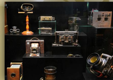
Коллекция стереоскопов XIX века