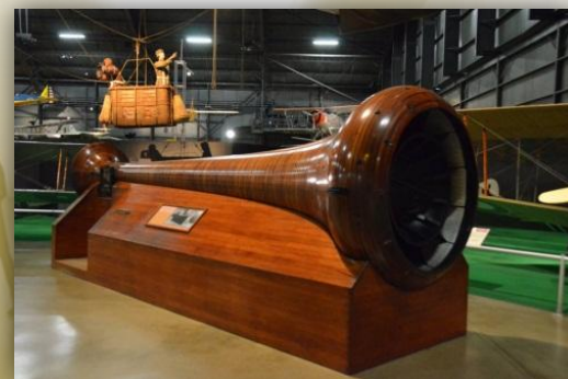
Аэродинамическая труба братьев Райт (1916 год)