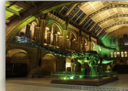
Гипсовый экспонат динозавра Diplodocus carnegii или просто диппи

Музей естественной истории — один из крупнейших государственных музеев Великобритании, в нем демонстрируется и хранится около 80 млн экспонатов.