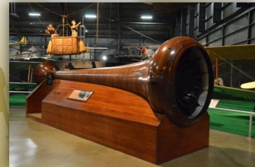
Аэродинамическая труба братьев Райт (1916 год)