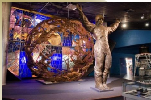
Скульптура Юрия Гагарина