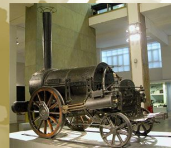
Паровоз «Пыхтящий Билли»