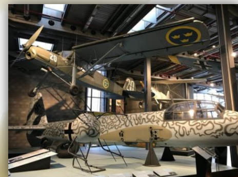
Самолеты времен Второй мировой

Технический музей в Берлине основан в 1982 . На крыше здания установлен «изюмный бомбардировщик» Douglas C-47 Skytrain. Музей в Берлине манит всех, кто не ровно дышит к технике. Это огромный музей. 3 этажа здания занимает только экспозиция водного транспорта. Здесь вы узнаете, как развивались технологии во всех отраслях нашей жизни. В техническом музее Берлина можно не только смотреть, но и делать. Например, отпечатать лист бумаги на старинном типографском станке. В этом музее есть свой планетарий, обсерватория и научный центр.