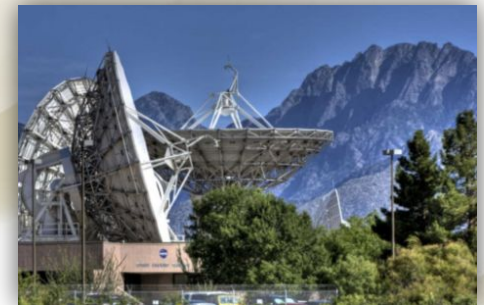
Центры связи NASA

Центр Эймса является одним из основных центров НАСА, и расположен в Кремниевой долине, вблизи от множества высокотехнологичных компаний, корпоративных инвестфондов, университетов лабораторий, которые заслужили для этой местности репутацию места, где развиваются новые технологии. В центре занимаются исследованиями и технологиями для авиации, космических полетов и информационными технологиями. Центр участвовал во многих миссиях НАСА, он лидирует в астробиологии, малых космических аппаратах, роботизированных исследованиях Луны, в поисках пригодных для жизни планет, суперкомпьютерах, термозащите, и воздушной астрономии.