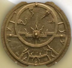
Астролябия, 1068 г.