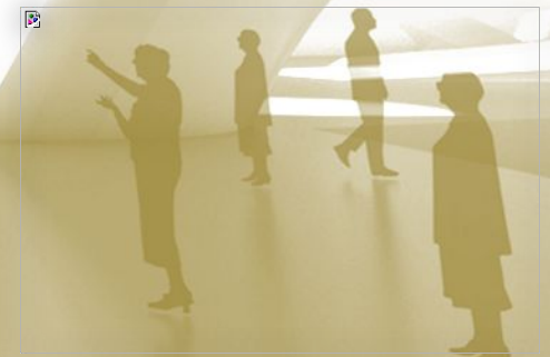
Оптическая иллюзия (комната ЭЙМСА)