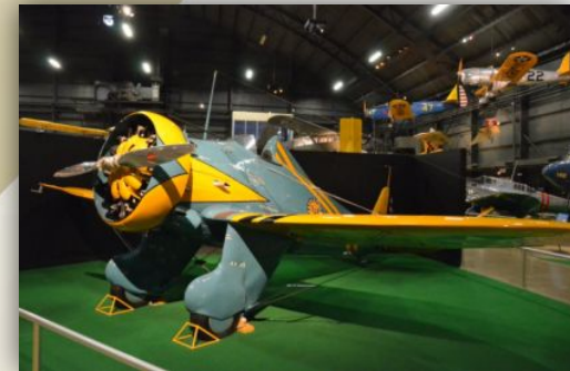
Первый металлический моноплан американских ВВС

В центре внимания — авиабаза Райт-Паттерсон в пригороде Дейтона, штат Огайо, в которой собрана обширная коллекция боевых самолётов и оружия. Здесь можно увидеть самолёты президентов Франклина Рузвельта, Гарри Трумена, Дуайта Эйзенхауэра, Джона Кеннеди и Ричарда Никсона, а также множество списанной авиационной техники Второй мировой войны, войны во Вьетнаме и других войн.