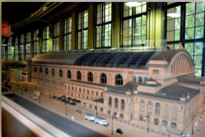
Макет вокзала Берлин