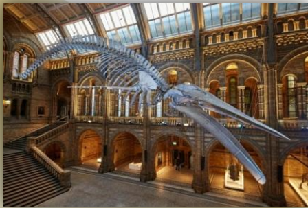
Модель синего кита, 25 метров