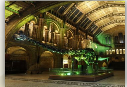
Гипсовый экспонат динозавра Diplodocus carnegii или просто диппи

Музей естественной истории — один из крупнейших государственных музеев Великобритании, в нем демонстрируется и хранится около 80 млн экспонатов.