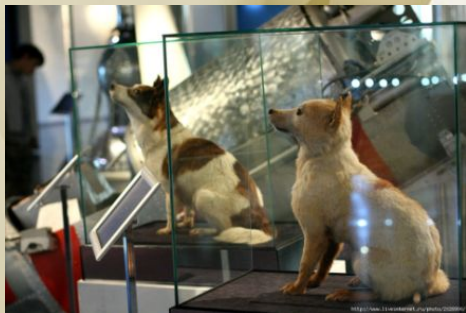
Чучела Белки и Стрелки в Музее