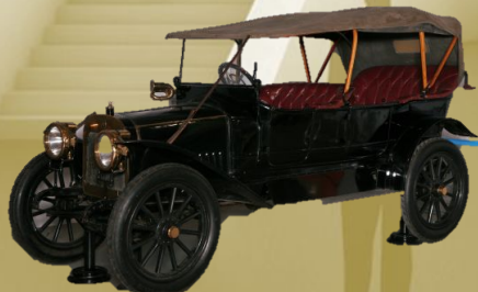
«Автомобиль «Руссо-Балт K12/20» 1911

Политехнический музей — один из крупнейших научно-технических музеев мира. Он был создан на основе фондов Политехнической выставки 1872 года по инициативе Общества любителей естествознания, антропологии и этнографии. В музее собраны и бережно хранятся устройства и предметы, иллюстрирующие этапы развития технической мысли. В декабре 1991 года музей был объявлен особо ценным объектом российского культурного наследия.