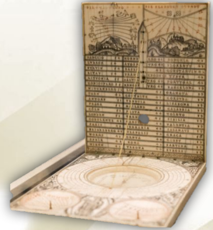
Солнечные часы, 1612 г.

Оксфордский музей истории науки – это первый научный музей в мире. Он появился в конце XVII века, когда английский ученый и антиквар Элиас Эшмол завещал музею свою коллекцию античных и средневековых инструментов.