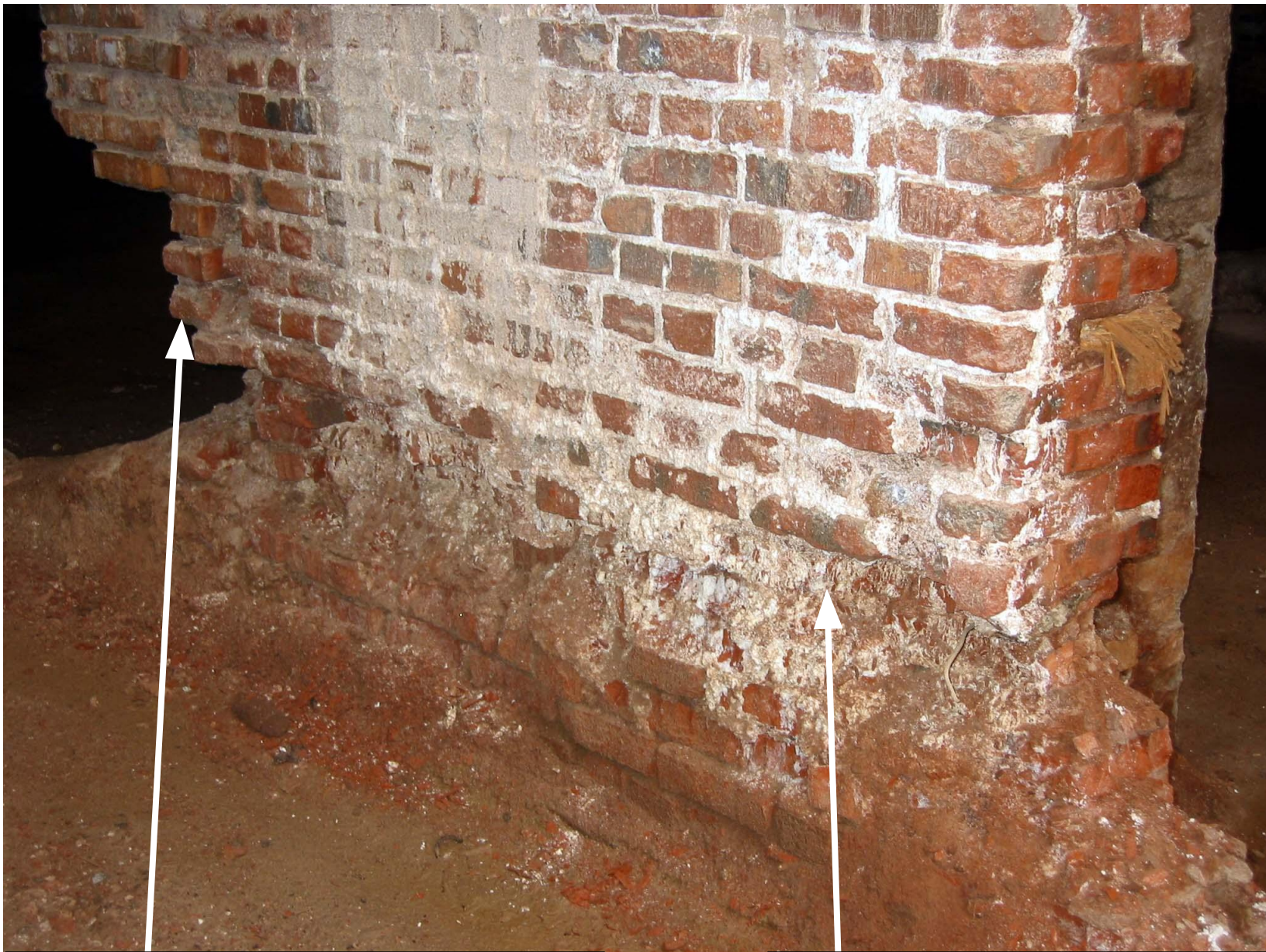
Сильная эрозия кладки столбов. Вывалы. Уменьшение площади сечения столбов