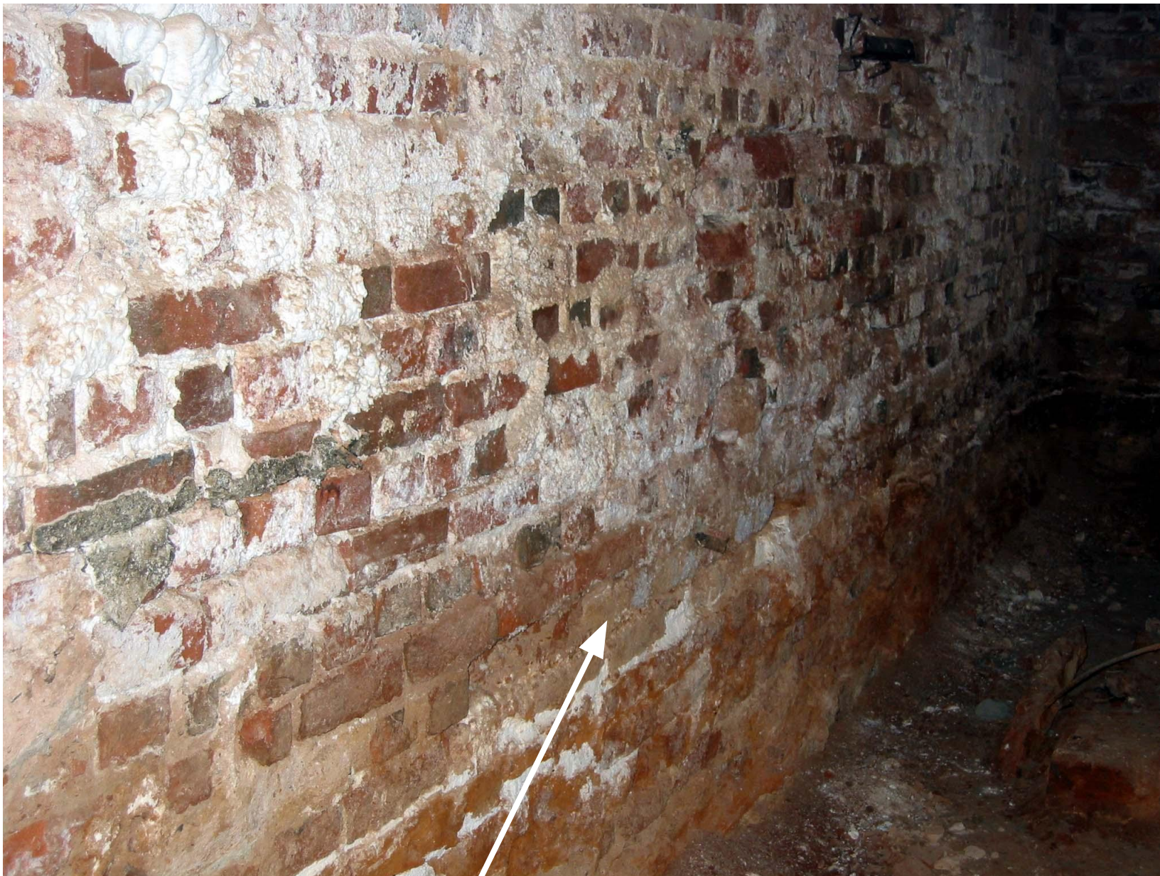
Сильная эрозия кладки стен. Высолы. Отложения солей на кладке