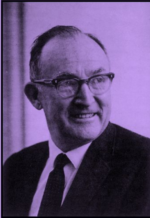
Джордж Келли (1905— 1967)- американский психолог

Человек — это исследователь, пытающийся понять, что с ним происходит, и предсказать, что с ним произойдет в будущем. В связи с этим на поведение человека большое влияние оказывают когнитивные и интеллектуальные процессы. Человек воспринимает и интерпретирует мир с помощью определенных моделей, которые Келли назвал конструктами. Личность — это организованная система важных конструктов, т.е. личность — это то, как человек воспринимает и истолковывает свой жизненный опыт. Дружба, любовь, нормальные взаимоотношения возможны только тогда, когда люди имеют сходные конструкты.