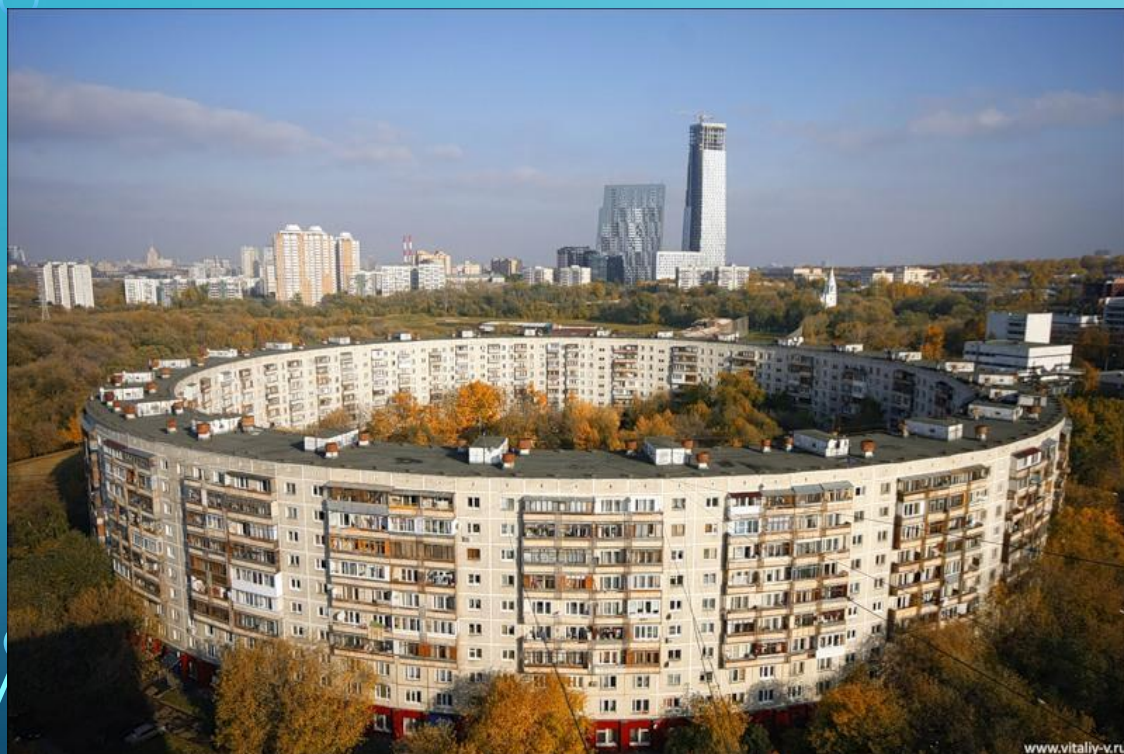
Startseite Dowschenko 6

NUR WENIGE MENSCHEN WISSEN, ABER IN MOSKAU GIBT ES ZWEI RINGE ZU HAUSE.