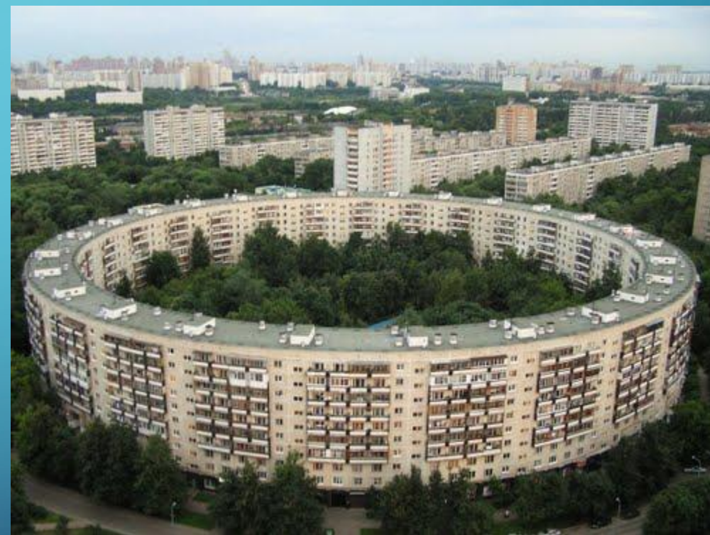
Startseite Nezhsinskaya 13