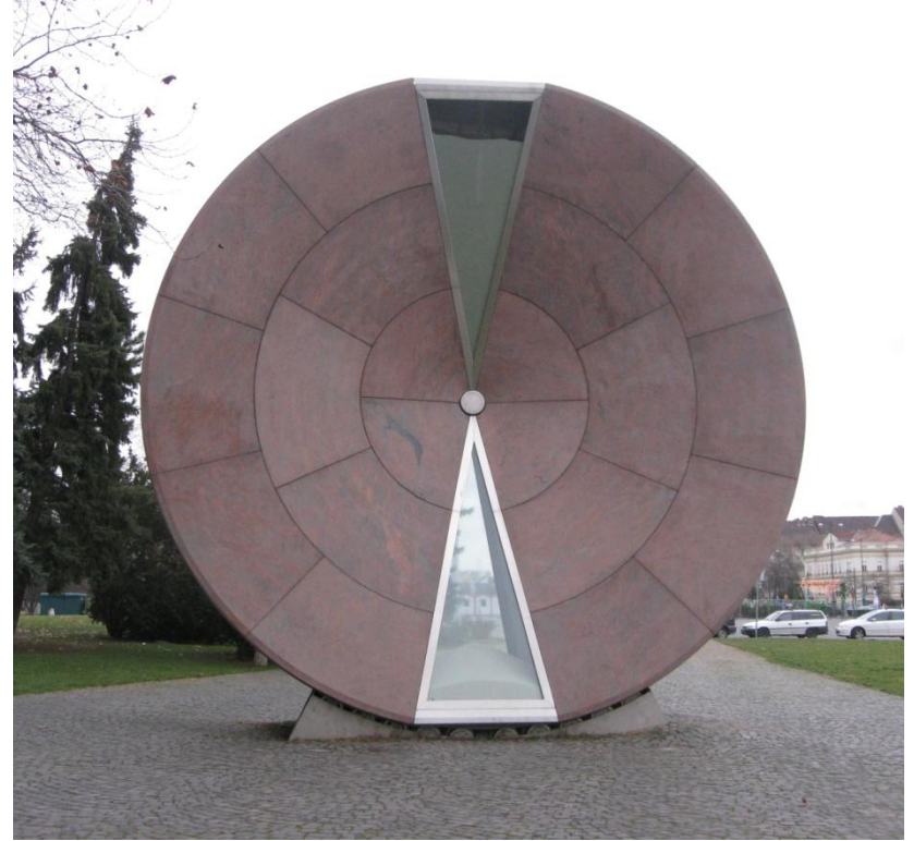
Будапешт (Угорщина) - Найбільший у світі пісочний годинник

Близько 2000 років людина винайшла ще один вид годинника – пісочний годинник. Він складався з двох порожніх скляних посудин, з'єднаних таким чином, що пісок міг вільно пересипатися з однієї чаші в іншу. Верхню посудину наповнювали піском у такій кількості, що він висипався через отвір протягом однієї години.