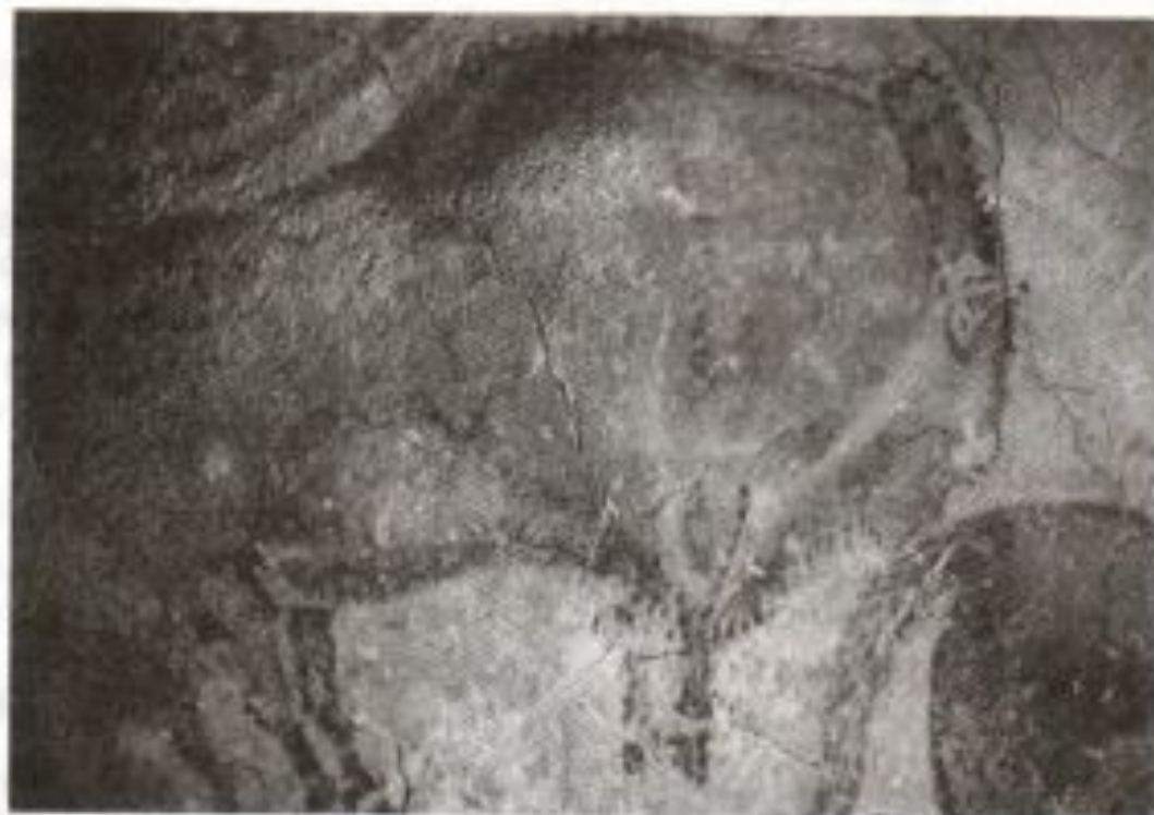
Наскальная живопись. Бизон. Пещера Альтамира. Испания. XIV тыс. до н. э.