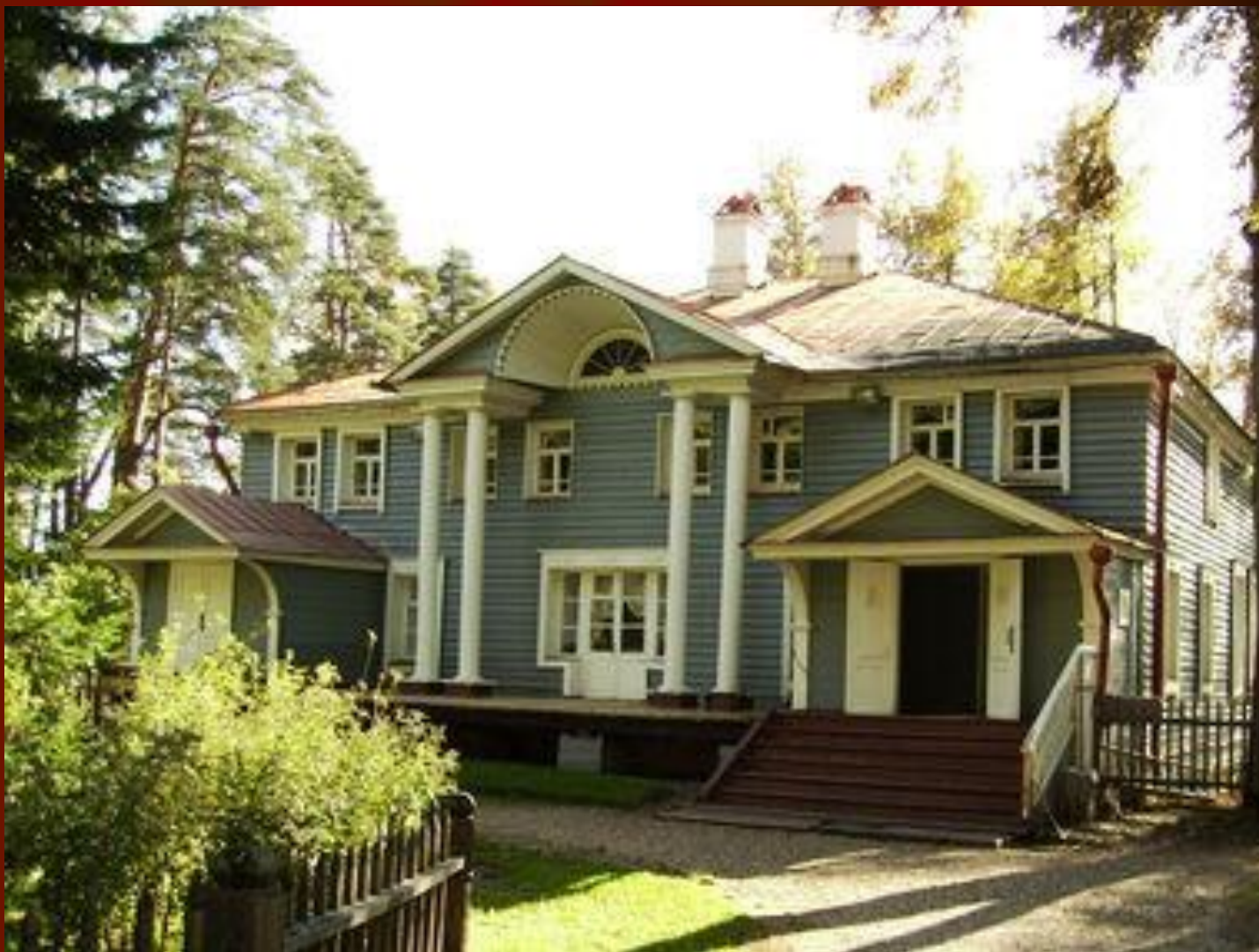
Барский дом в имени Щельково