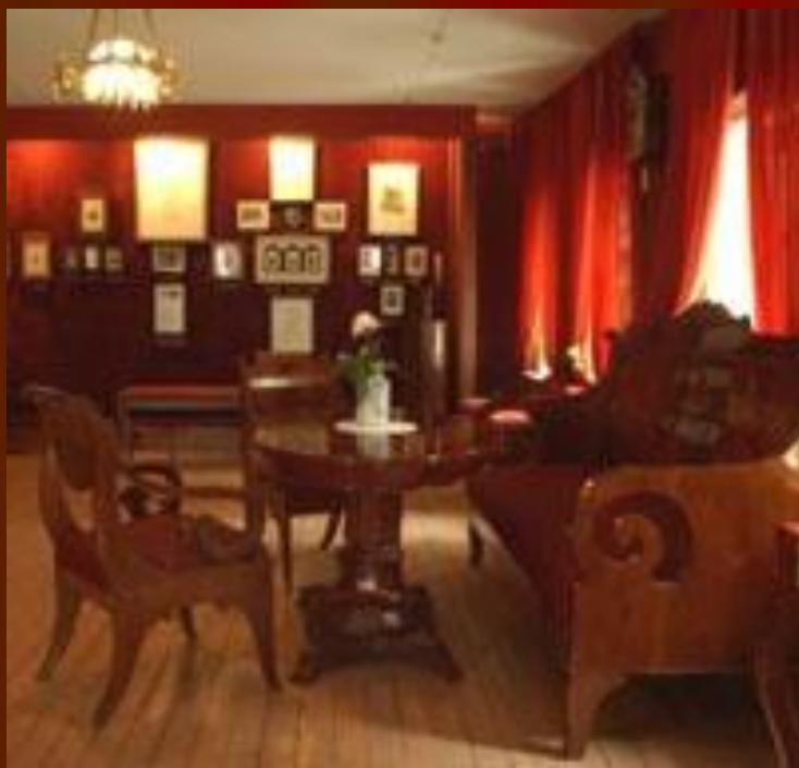
Экспозиция Дома-музея А.Н.Островского в Замоскворечье