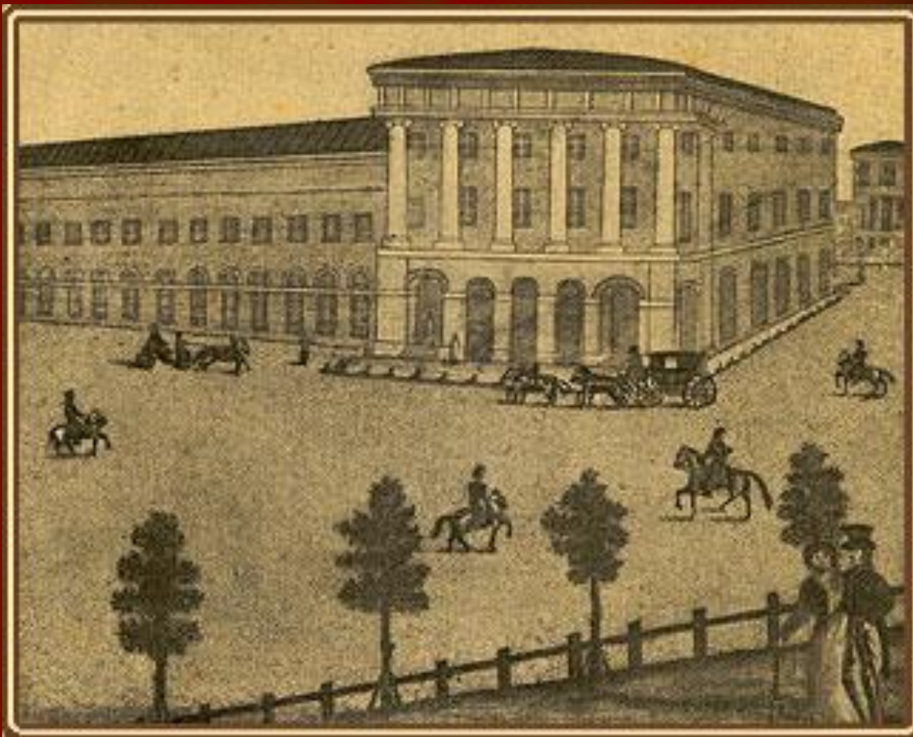
Государственный Академический Малый Художественный театр