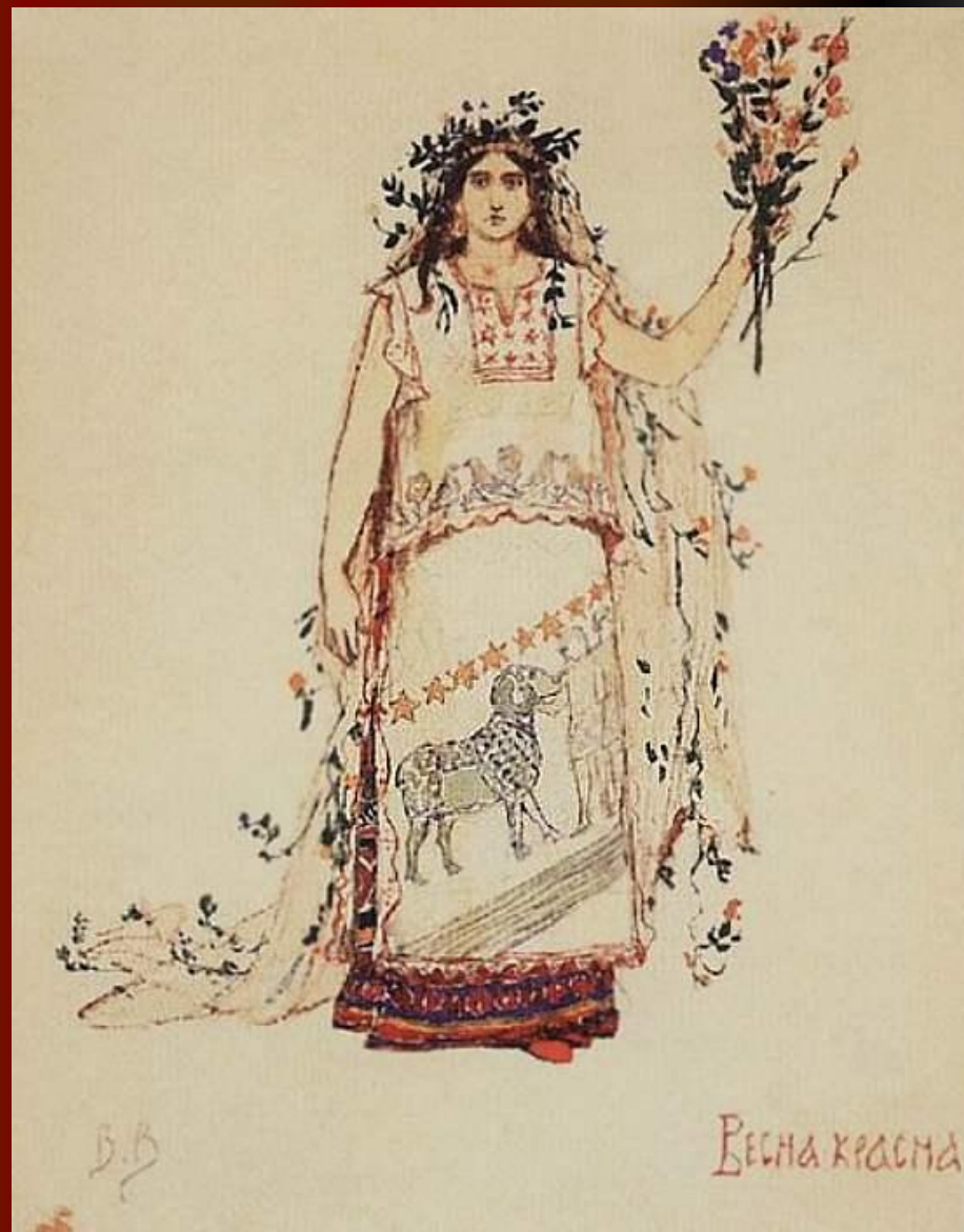
В.М.Васнецов Весна-Красна 15