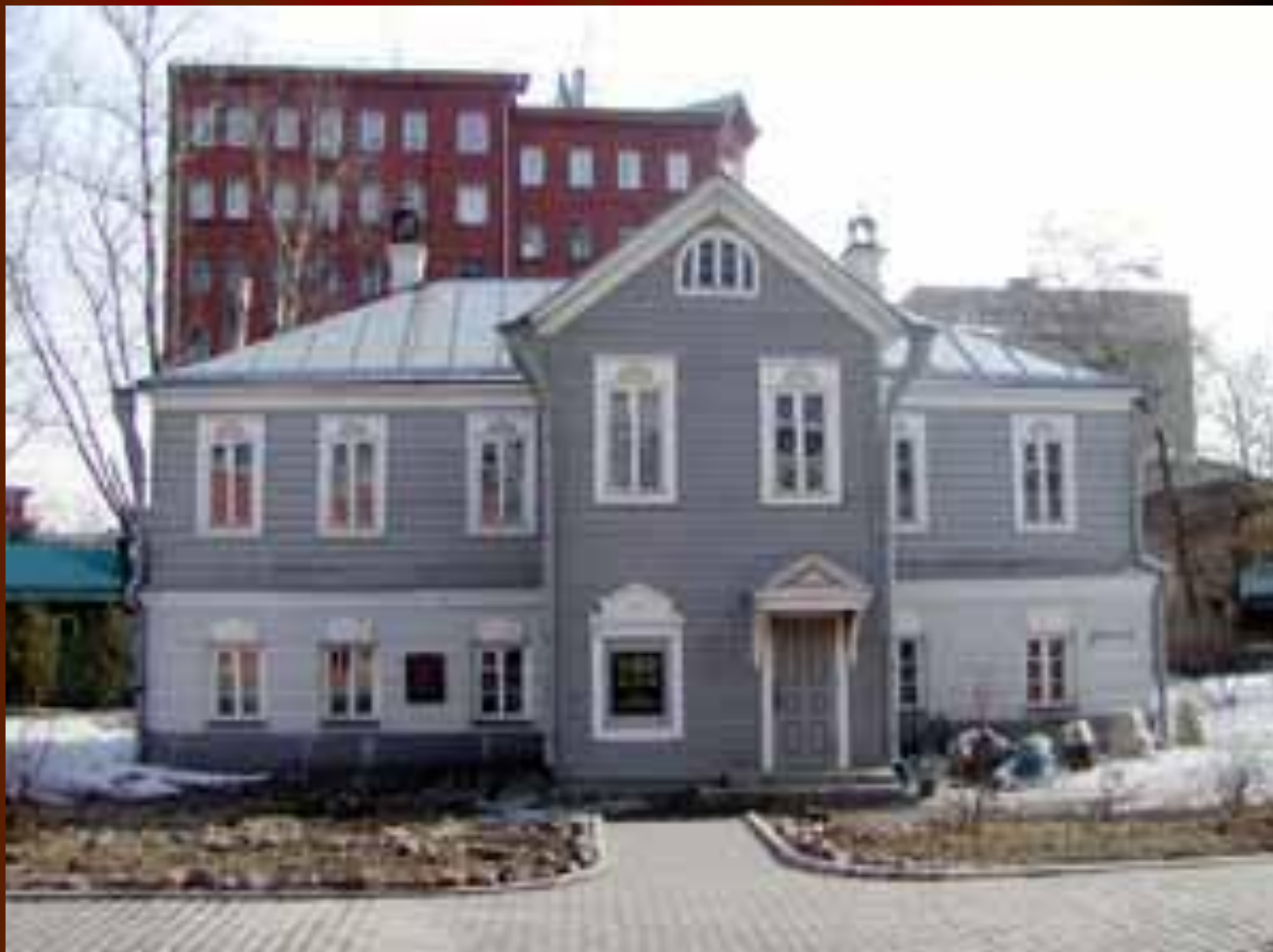
Замоскворечье. Дом семьи Островских