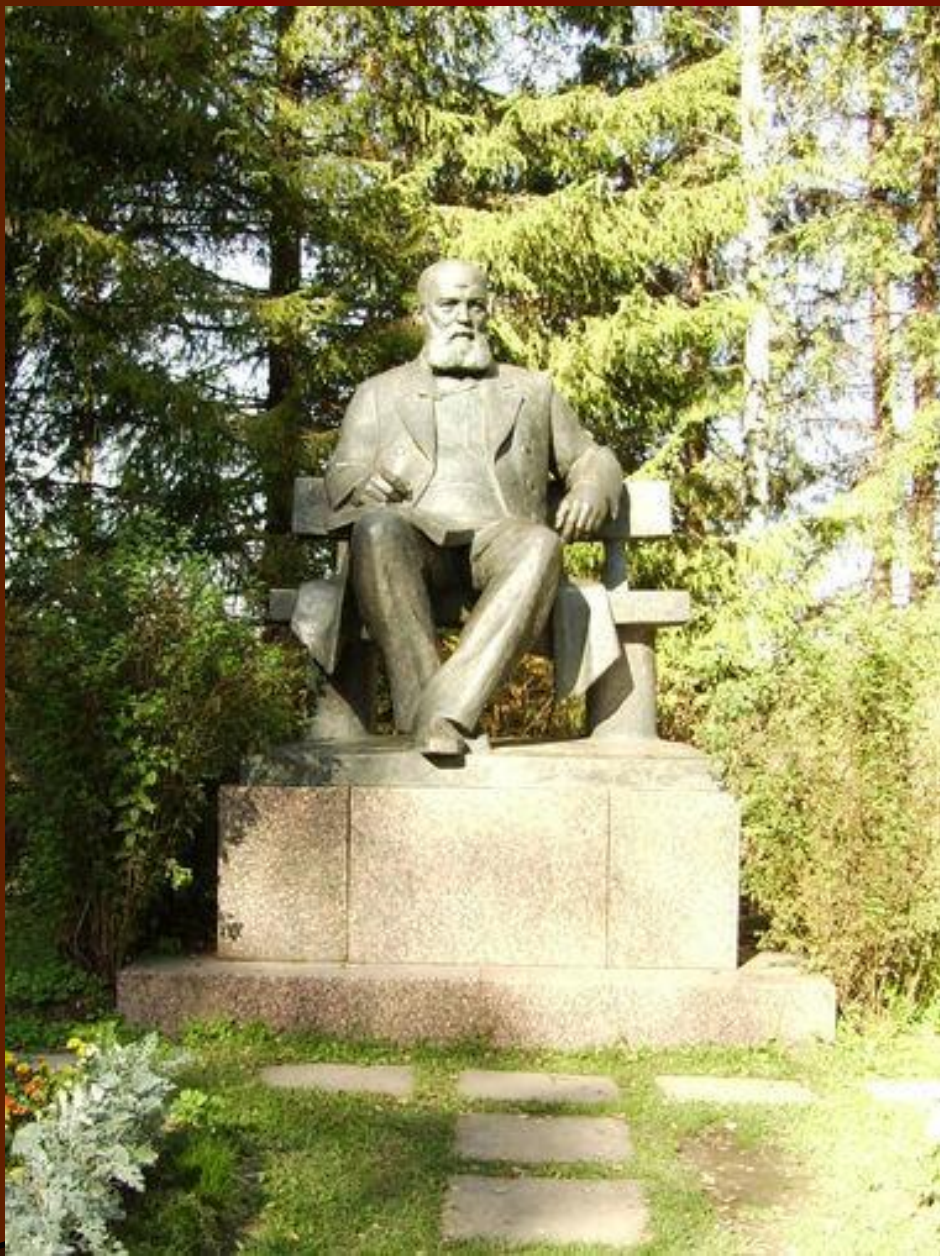
Памятник А.Н. Островскому Щельково