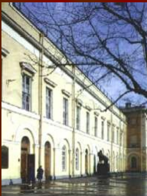
Памятник А.Н. Островскому у входа в Малый театр Скульптор Н.Андреев