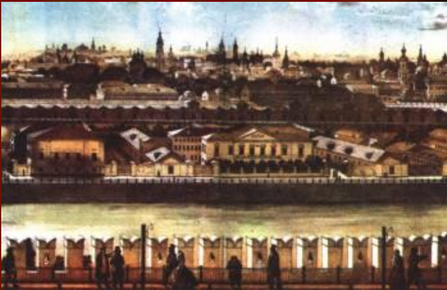
Вид на Замоскворечье