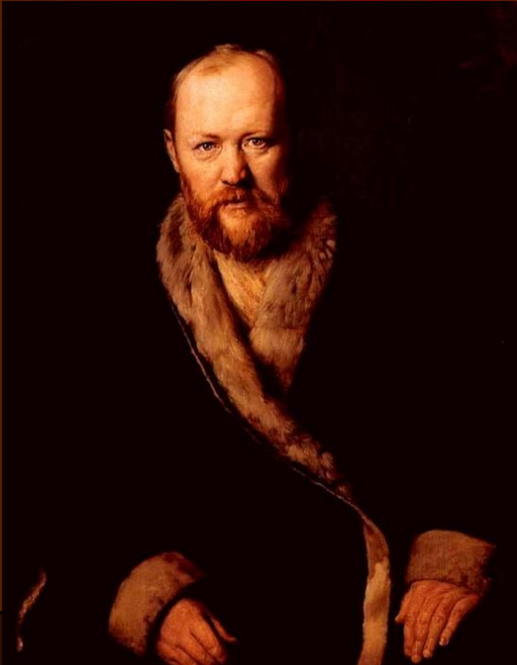
Александр Николаевич Островский (1823-1886)