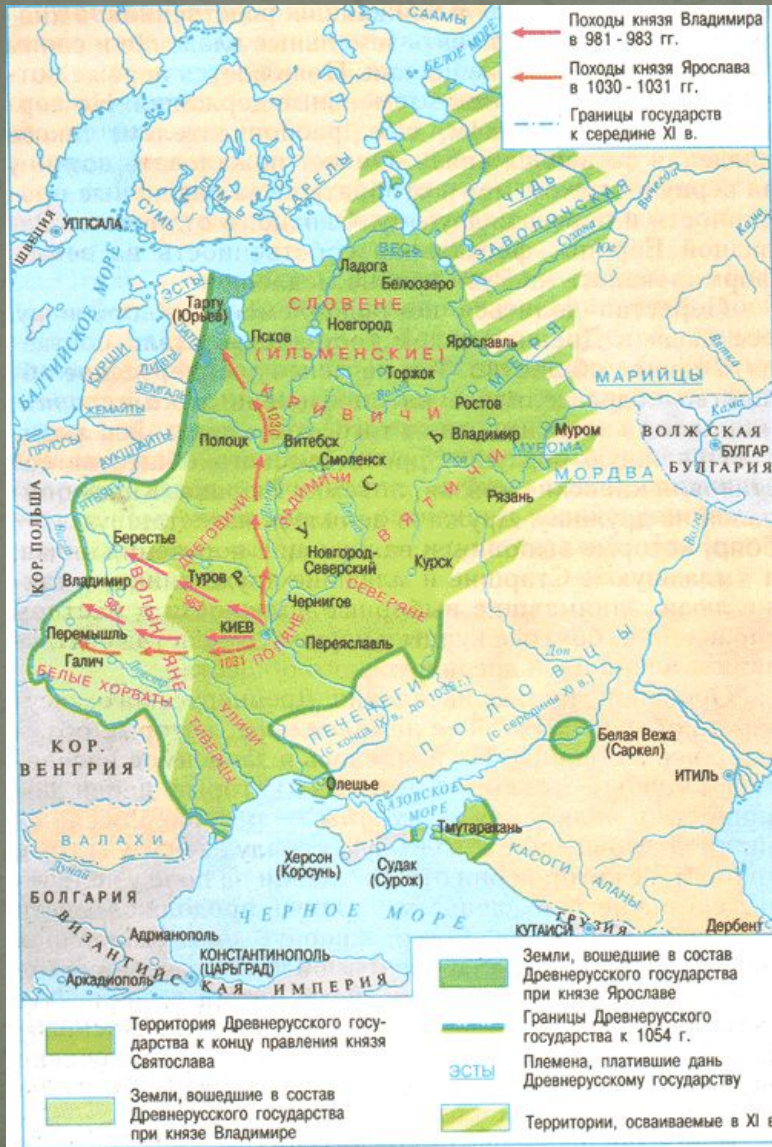
Русь в X — начале XII века.