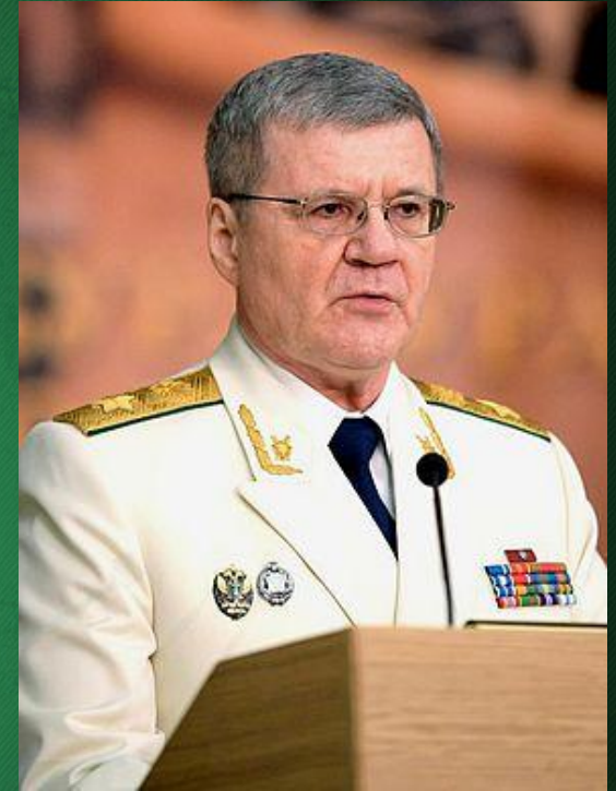
Генеральный прокурор Российской Федерации Юрий Яковлевич Чайка

В широком смысле: прокурор - физическое лицо, состоящее на постоянной или временной службе в органах прокуратуры, принятое на работу в порядке, установленном Федеральным законом « О прокуратуре РФ » и исполняющее должностные обязанности, предусмотренные тем же законом и приказом вышестоящего прокурора.