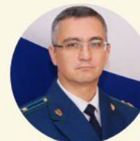
Прокурор Амурской области Медведев Руслан Федорович

В Амурской области суд по заявлению прокурора обязал администрацию Завитинского района предоставить сироте жилое помещение Прокуратура Завитинского района 16 июня 2017, 16:00