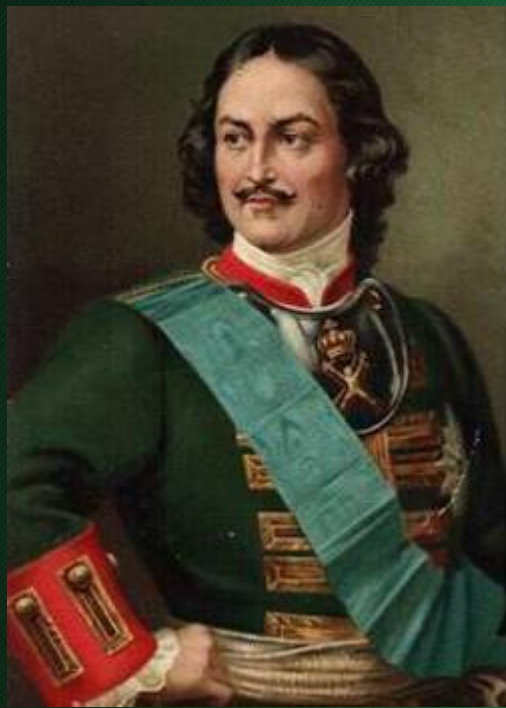
Последний царь всея Руси, первый Император Всероссийский Петр I Алексеевич