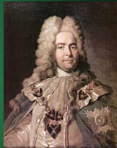
Первый генерал-прокурор Ягужинский П.И.