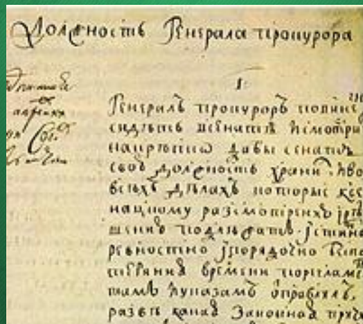
Отрывок текста Указа Петра I об учреждении нового государственного органа - прокуратуры