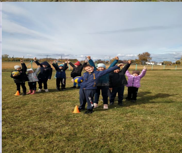
Соревнования «Весёлые старты»