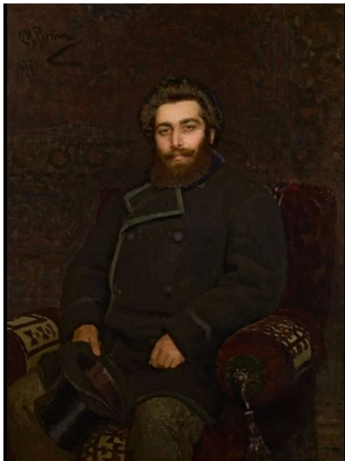
А. И. Куинджи (Портрет И. Е. Репина 1877, Русский музей)