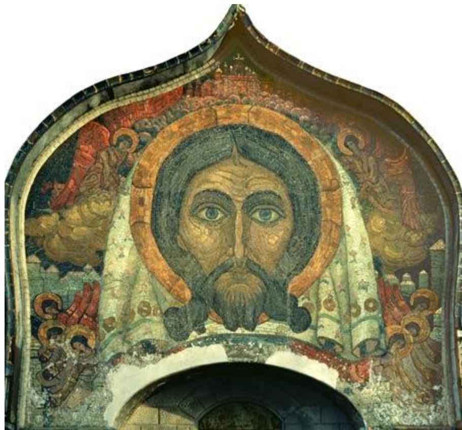
Н. К. Рерих. Спас Нерукотворный. Фрагмент мозаики церкви Св. Духа в Талашкине. 1914