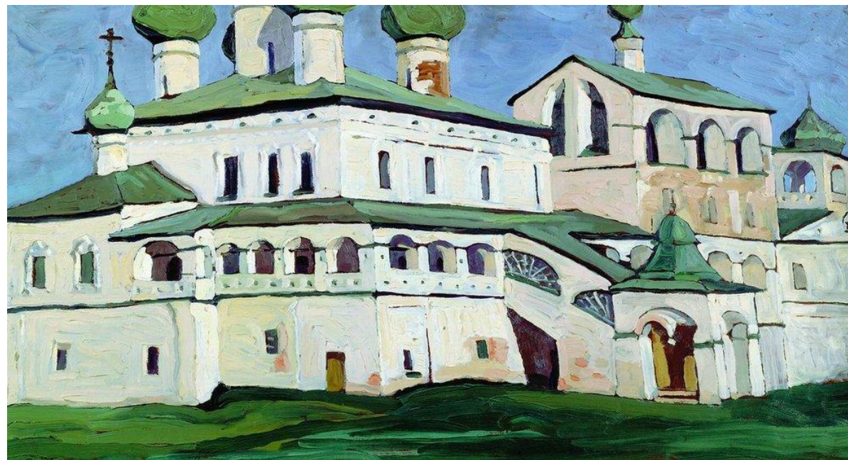
Воскресенский монастырь в Угличе