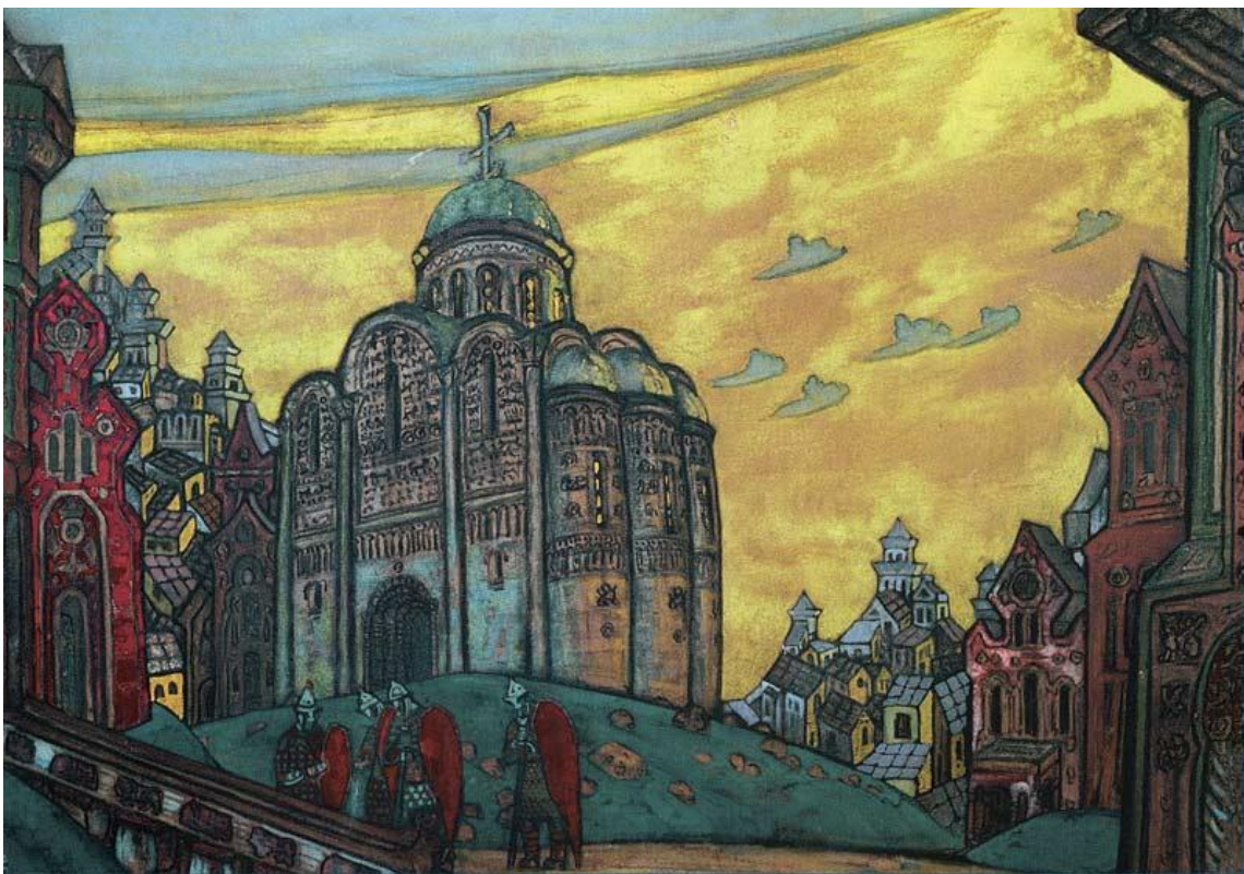
Н.К. Рерих. Путивль. 1914. (Эскиз декорации к опере А.П. Бородина «Князь Игорь»).