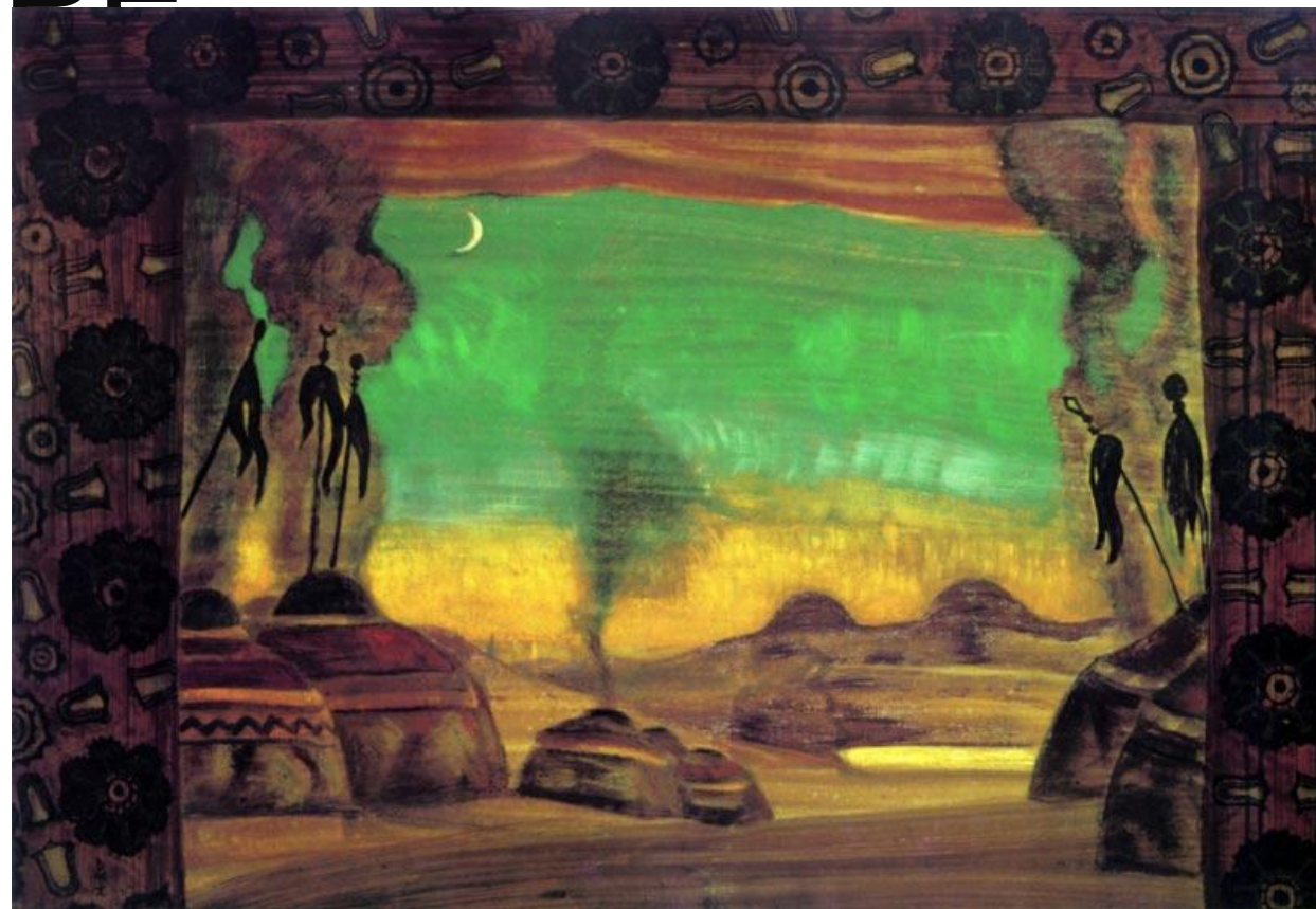
1909. Декорации к «Половецкие пляски» Бумага на картоне, темпера, гуашь. 58,5 × 84 5 Музей Виктории и Альберта, Лондон