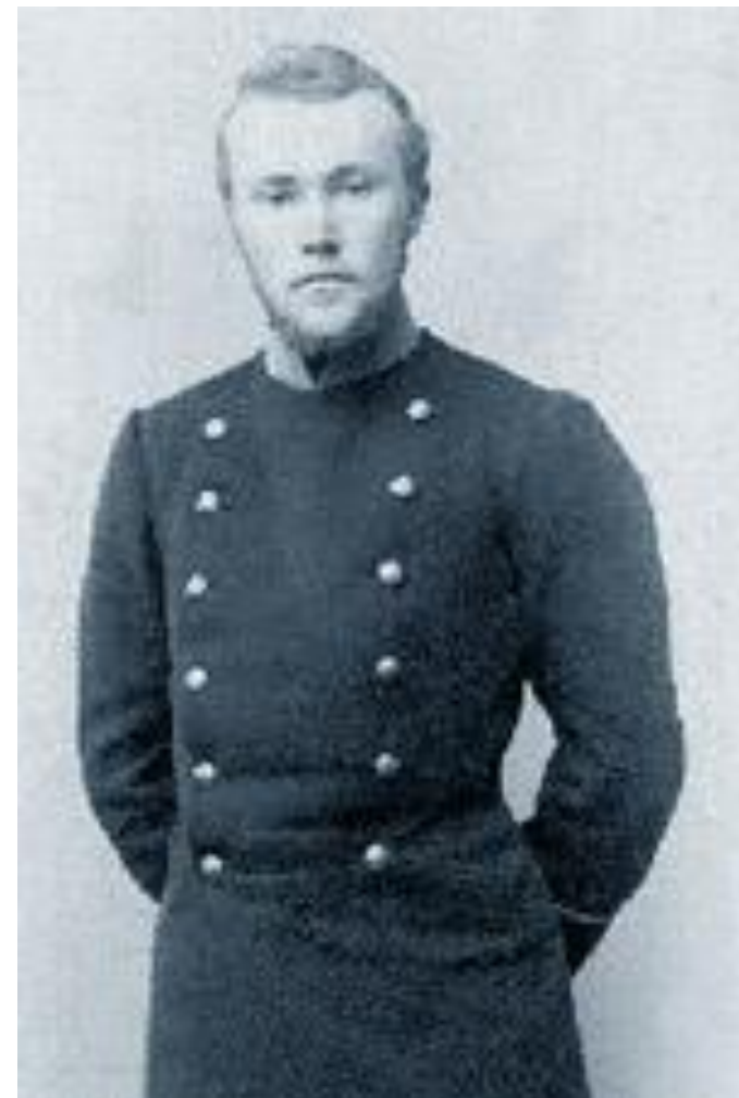
Николай Рерих в университете