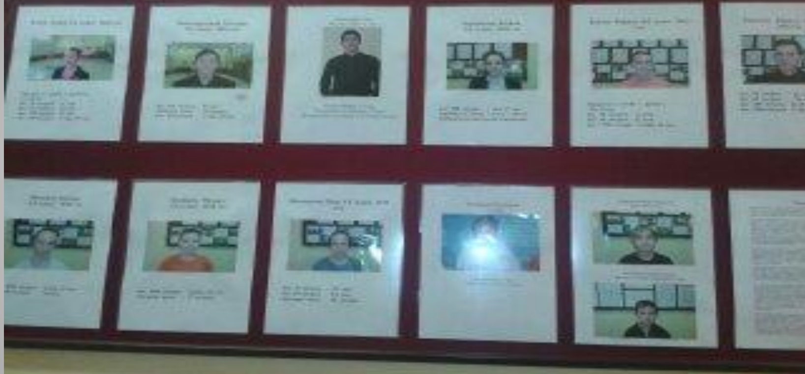
Стенд «Лучшие спортсмены школы»