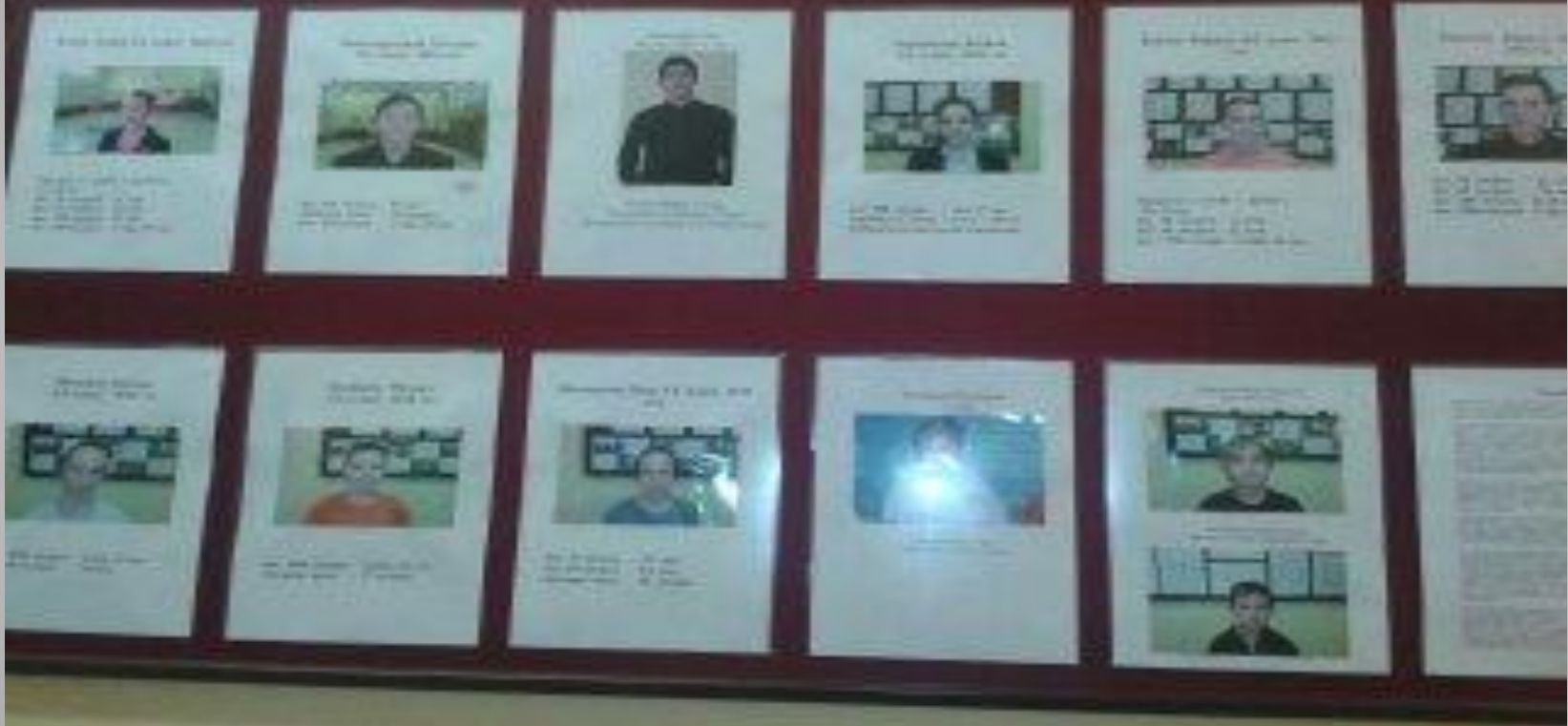
Стенд «Лучшие спортсмены школы»