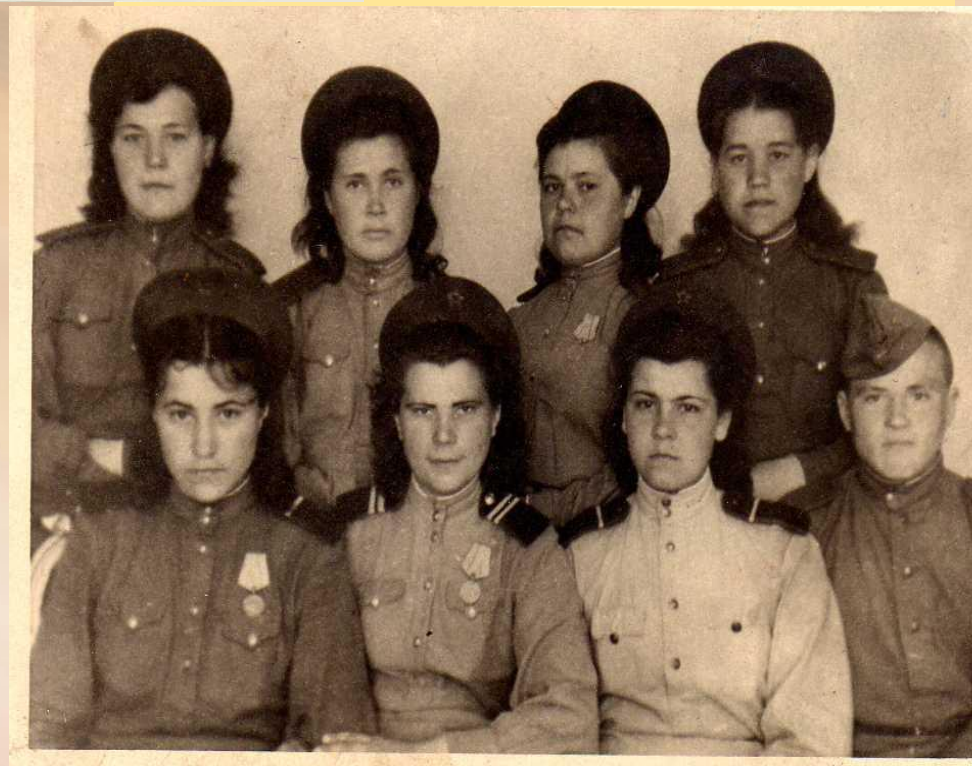
Прибористы 12-ой батареи, Латвия Двинск 21 мая 1945 г