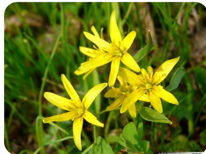
Гусиный лук желтый