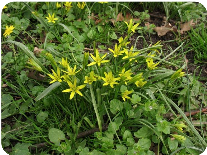
Гусиный лук луговой