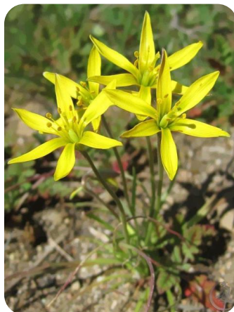
Гусиный лук луковичноносный