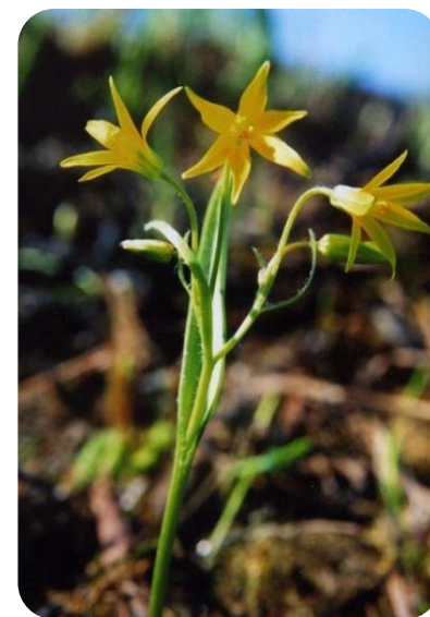
Гусиный лук зернистый