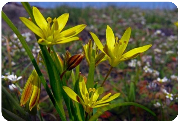
Гусиный лук румяный