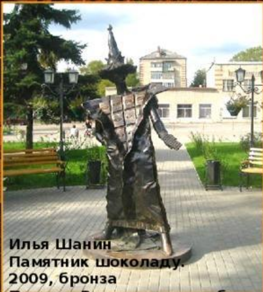
Илья Шанин Памятник шоколаду. 2009, бронза