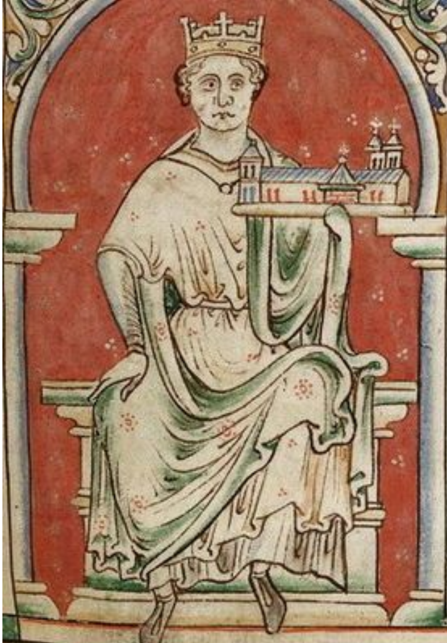
Иоанн Безземельный. 1199-1216

В итоге, Весной 1215 г. бароны при поддержке рыцарства и горожан начали восстание. Король вынужден был пойти на уступки и подписать составленную баронами Великую хартию вольностей (Magna Charta Libertatum).