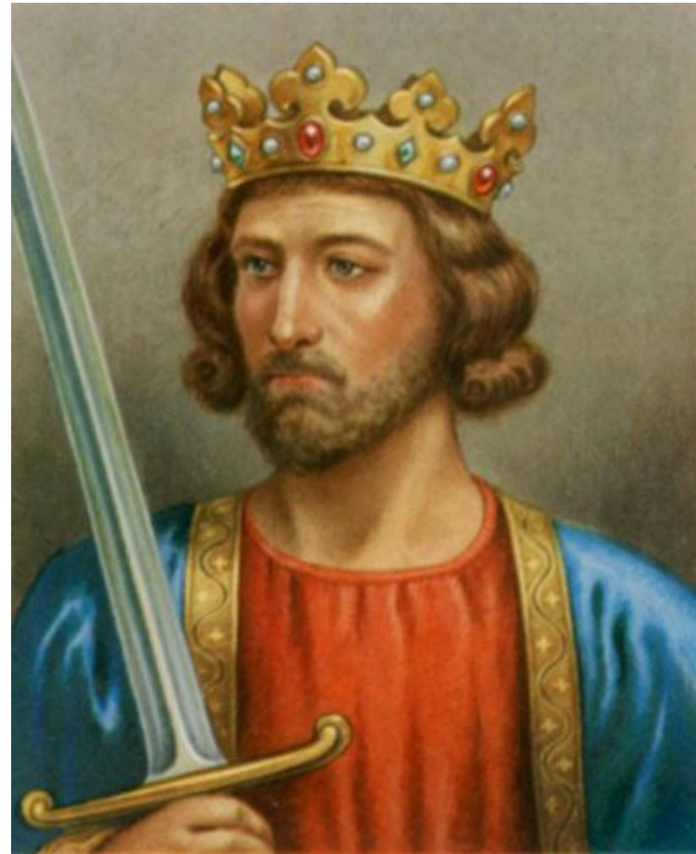
Эдуард I .1272-1307

Позже парламент стал состоять из двух палат: верхней — палаты лордов и нижней — палаты общин.