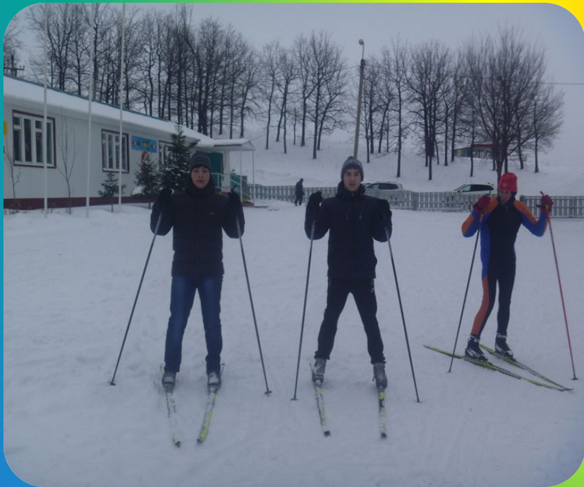
Посещение лыжной базы

Беседа о рациональном и правильном питании