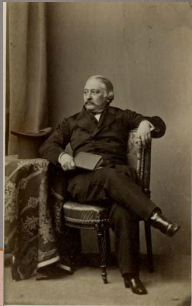
А. А. Краевскій, Редакторъ газеты „Голосъ.“

«Насколько сил хватит у русского печатного органа, он должен поддерживать всякую прогрессивную меру правительства (...) и побивать всеми своими кулаками всякое поползновение к ретроградности»»