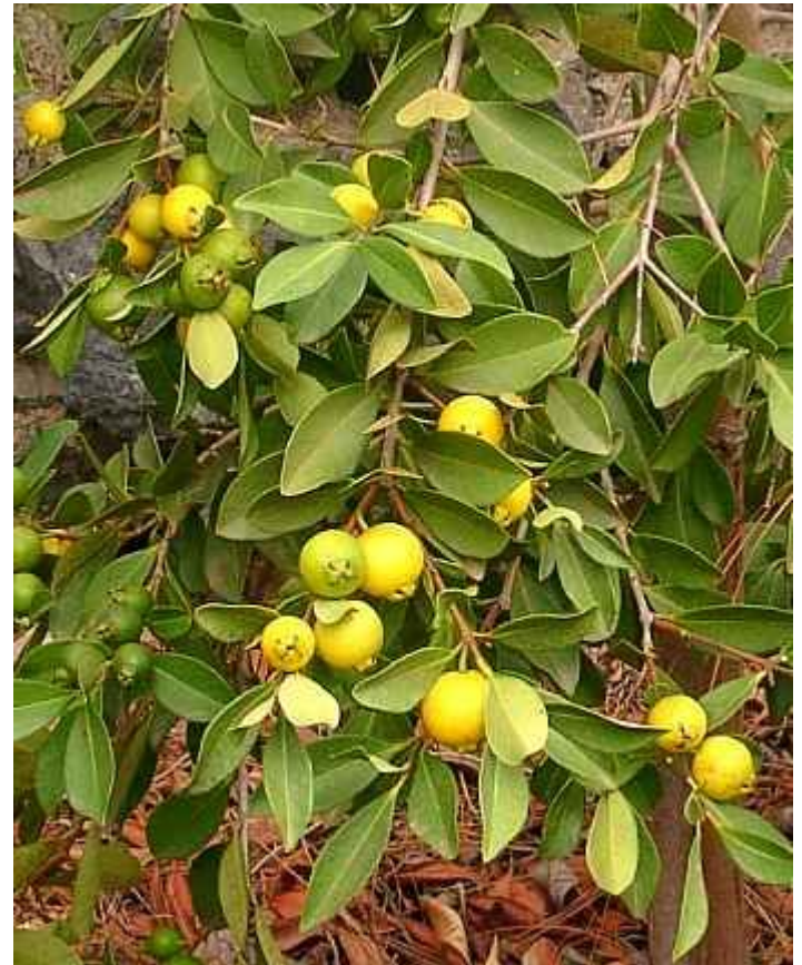
GUAYABO Y OTROS MIRTÁCEOS