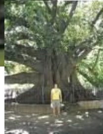
OMBÚ O BELLASOMBRA