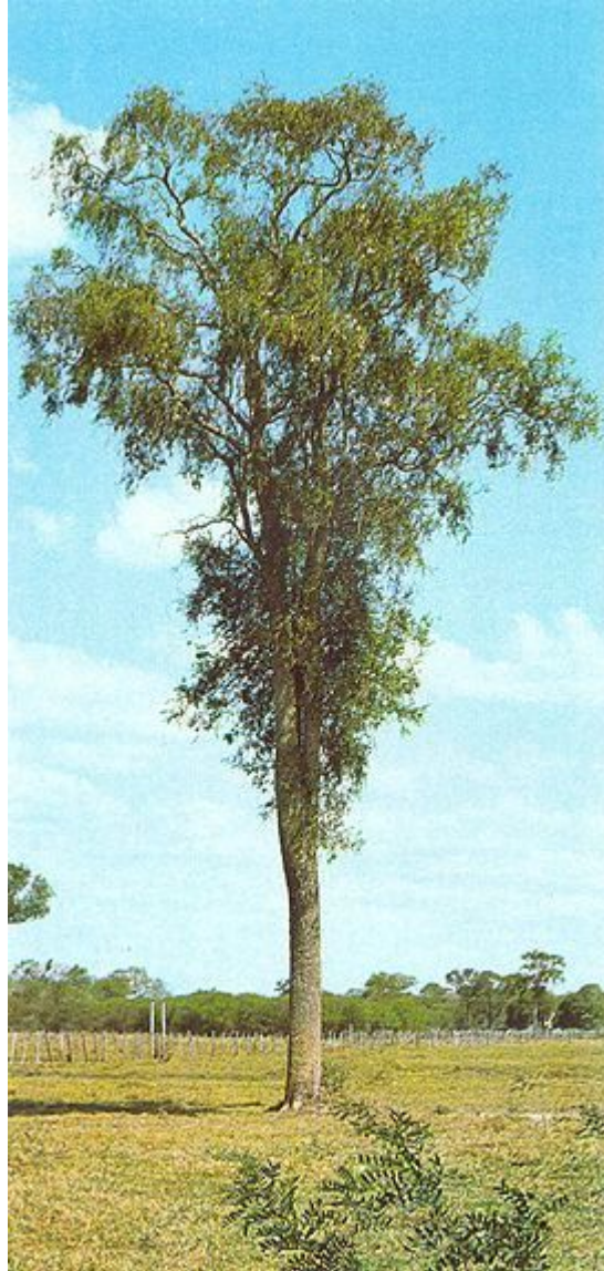
QUEBRACHO QUEBRAR + HACHA