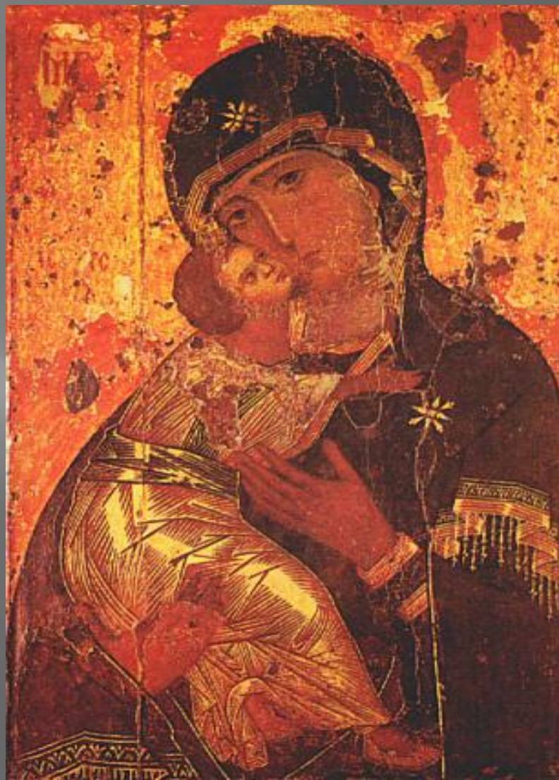
Икона Владимирской Божьей Матери

Иконопись играла важную роль в Древней Руси, где она стала одной из основных форм изобразительного искусства. Самые ранние древнерусские иконы имели традиции, как уже говорилось, византийской иконописи, но очень скоро на Руси возникли свои самобытные центры и школы иконописи: Московская, Псковская, Новгородская, Тверская, среднерусских княжеств, «северные письма» и др. Появились и собственные русские святые, и собственные русские праздники (Покров Богородицы и др.), которые нашли яркое отражение в иконописи. Само слово "икона" в переводе с греческого означало образ, изображение. Наиболее часто обращались к образам Христа, Богоматери, святых, а также изображались события, почитавшиеся священными.