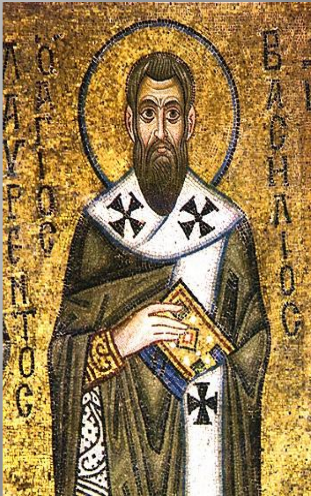
Святитель Василий Великий. Мозаика алтаря, XI век