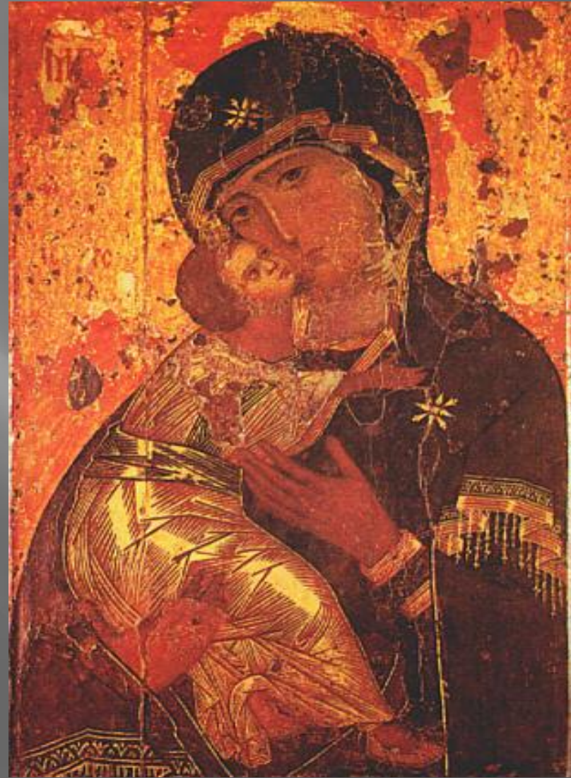
Икона Владимирской Божьей Матери

Иконопись играла важную роль в Древней Руси, где она стала одной из основных форм изобразительного искусства. Самые ранние древнерусские иконы имели традиции, как уже говорилось, византийской иконописи, но очень скоро на Руси возникли свои самобытные центры и школы иконописи: Московская, Псковская, Новгородская, Тверская, среднерусских княжеств, «северные письма» и др. Появились и собственные русские святые, и собственные русские праздники (Покров Богородицы и др.), которые нашли яркое отражение в иконописи. Само слово "икона" в переводе с греческого означало образ, изображение. Наиболее часто обращались к образам Христа, Богоматери, святых, а также изображались события, почитавшиеся священными.