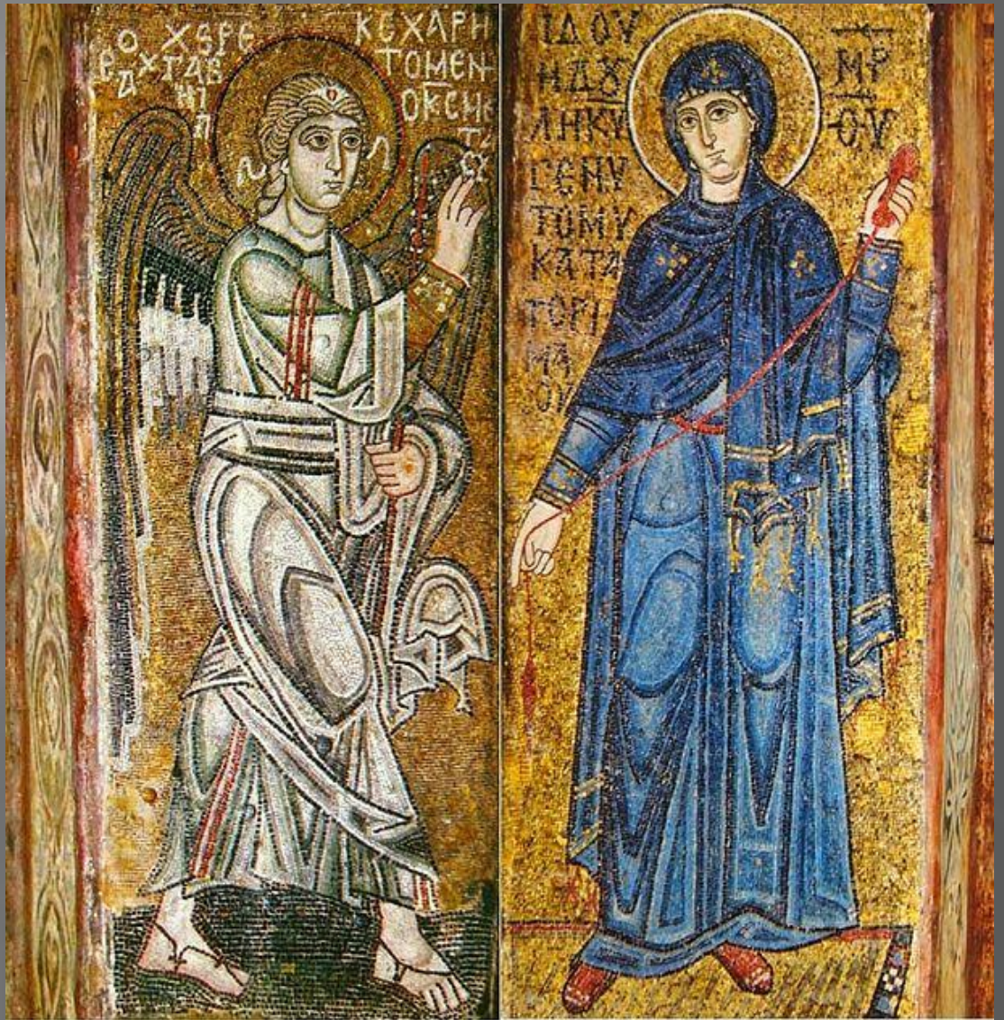
Благовещение. Мозаика на алтарных столбах, XI век