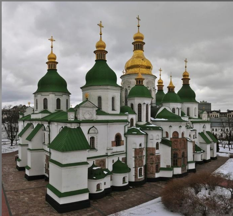
Софийский собор в Киеве

В византийском искусстве, считавшемся в первом тысячелетии нашей эры самым совершенным в мире, и живопись, и музыка, и искусство ваяния создавались в основном по церковным канонам, где отсекалось все, что противоречило высшим христианским принципам. Аскетизм и строгость в живописи (иконопись, мозаика, фреска), возвышенность, «божественность» греческих церковных молитв и песнопений, сам храм, становящийся местом молитвенного общения людей, - все это было свойственно византийскому искусству.