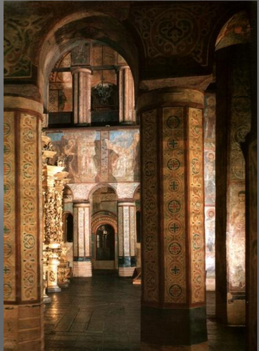
Фресковая роспись восточного трансепта в

В ряду изобразительных искусств Киевской Руси первое место принадлежит монументальной «живописи». Систему росписи храмов русские мастера восприняли от византийцев, и народное искусство повлияло на древнерусскую живопись. Мозаики и фрески Софии Киевской позволяют представить систему росписи средневекового храма. Мозаики покрывали наиболее важную в символическом смысле и наиболее освещенную часть храма – центральный «купол», подкупольное пространство, «алтарь». Остальная часть храма украшена фресками (сцены из жизни Христа, Богоматери, изображения проповедников, мучеников и др.). Уникальны светские фрески Софии Киевской: два групповых портрета Ярослава Мудрого с семьей и эпизоды придворной жизни (состязания на ипподроме, фигуры скоморохов, музыкантов, сцены охоты и т.п.).