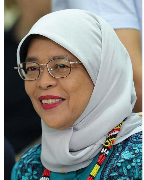
Президент Сингапура Халима Якоб