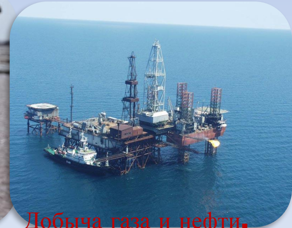
Добыча газа и нефти.