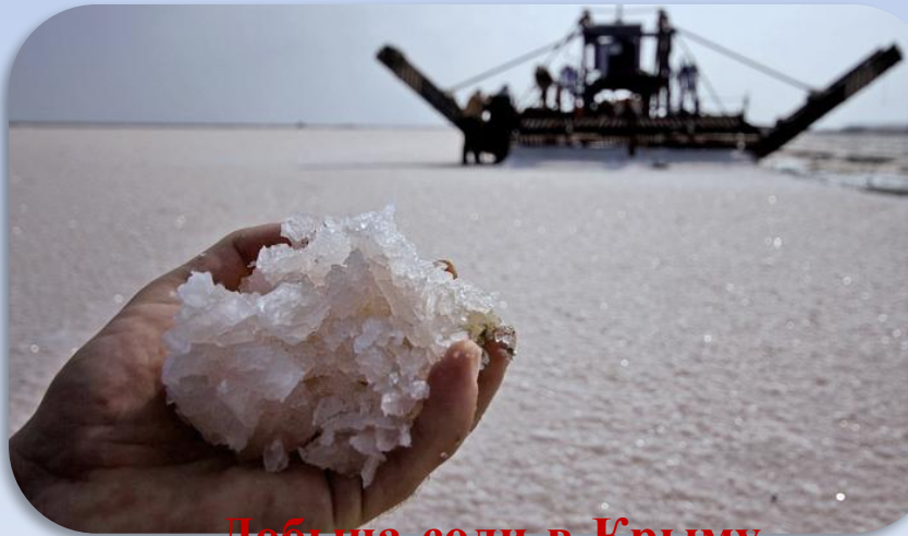
Добыча соли в Крыму. Озеро Сасык-Сиваш.