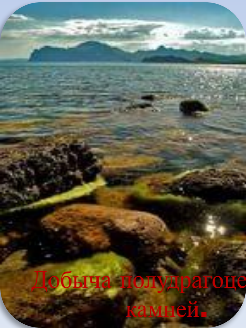
Добыча полудрагоценных камней.

Важным видом полезных ископаемых Крыма является поваренная соль. В Крыму осуществляется добыча газа и нефти.