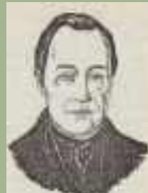
Конт Огюст (1798-1857)