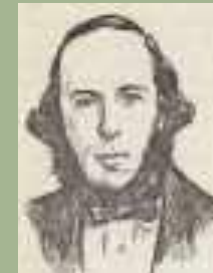
Спенсер Герберт (1820-1903)

НЕОПОЗИТИВИЗМ — совокупность философских течений, сложившихся в общем русле позитивистской традиции в 20—60-х годах XX в. и составивших содержание третьего этапа его развития.