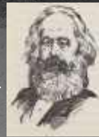
Маркс Карл Генрих (1818-1883)

МАРКСИЗМ — совокупность философских, экономических и социально-политических концепций, разработанных К. Марксом и Ф. Энгельсом и объединенных общей идеей коммунизма.