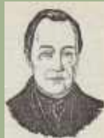
Конт Огюст (1798-1857)