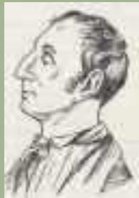
Сен-Симон Анри Де Рувруа (1760-1825)