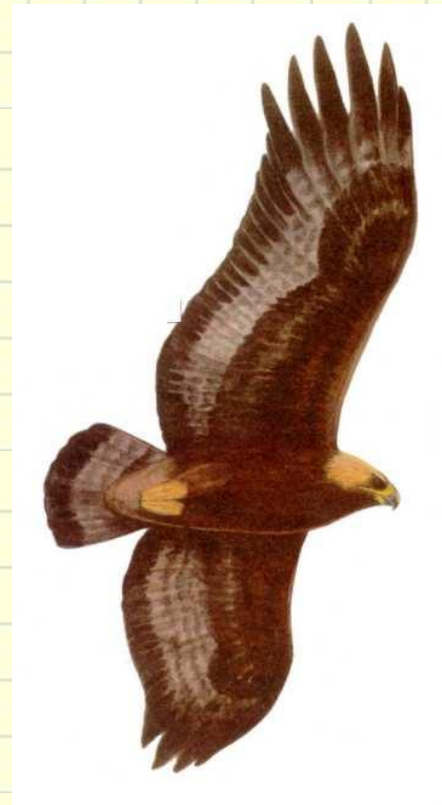
Л.Н. Толстой «Орел»