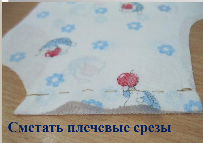
Сметать плечевые срезы

Задание: определить по фото, какой этап обработки плечевых срезов отсутствует