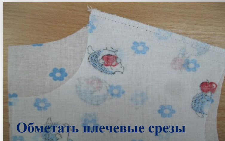
Обметать плечевые срезы