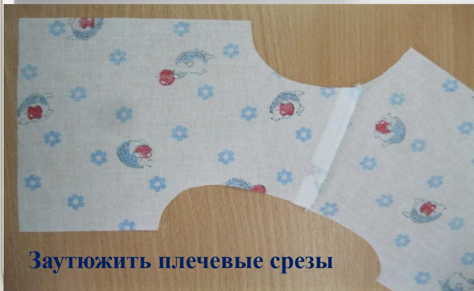
Заутюжить плечевые срезы