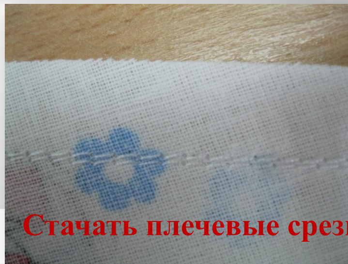
Стачать плечевые срезы