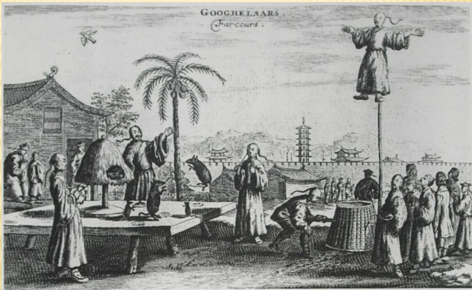
Бродячие циркачи в Китае, ок. 1655-57 гг.