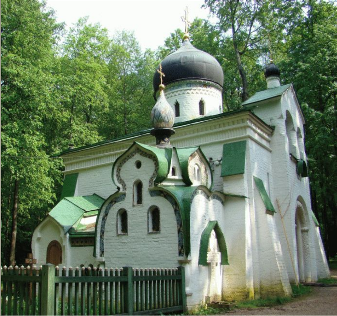
Абрамцевскую церковь, созданную и украшенную В.М.Васнецовым, И.Е.Репиным, В.Д.Поленовым и др. художниками, справедливо считают одним из первых образцов неорусского стиля

Первым памятником является церковь в Абрамцеве , над которой работали В.М.Васнецов и В.Д.Поленов. Авторы обратились к традициям древнерусского зодчества , но не копируя, а подвергая стилизации в духе модерна: смело сопоставляют кубический объём с кривыми линиями купола, скошенными контурами контрфорсов придают храму некоторую пирамидальность.