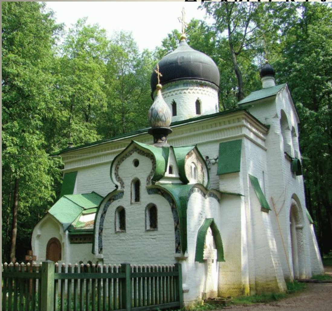
Абрамцевскую церковь, созданную и украшенную В.М.Васнецовым, И.Е.Репиным, В.Д.Поленовым и др. художниками, справедливо считают одним из первых образцов неорусского стиля

Первым памятником является церковь в Абрамцеве , над которой работали В.М.Васнецов и В.Д.Поленов. Авторы обратились к традициям древнерусского зодчества , но не копируя, а подвергая стилизации в духе модерна : смело сопоставляют кубический объём с кривыми линиями купола, скошенными контурами контрфорсов придают храму некоторую пирамидальность.