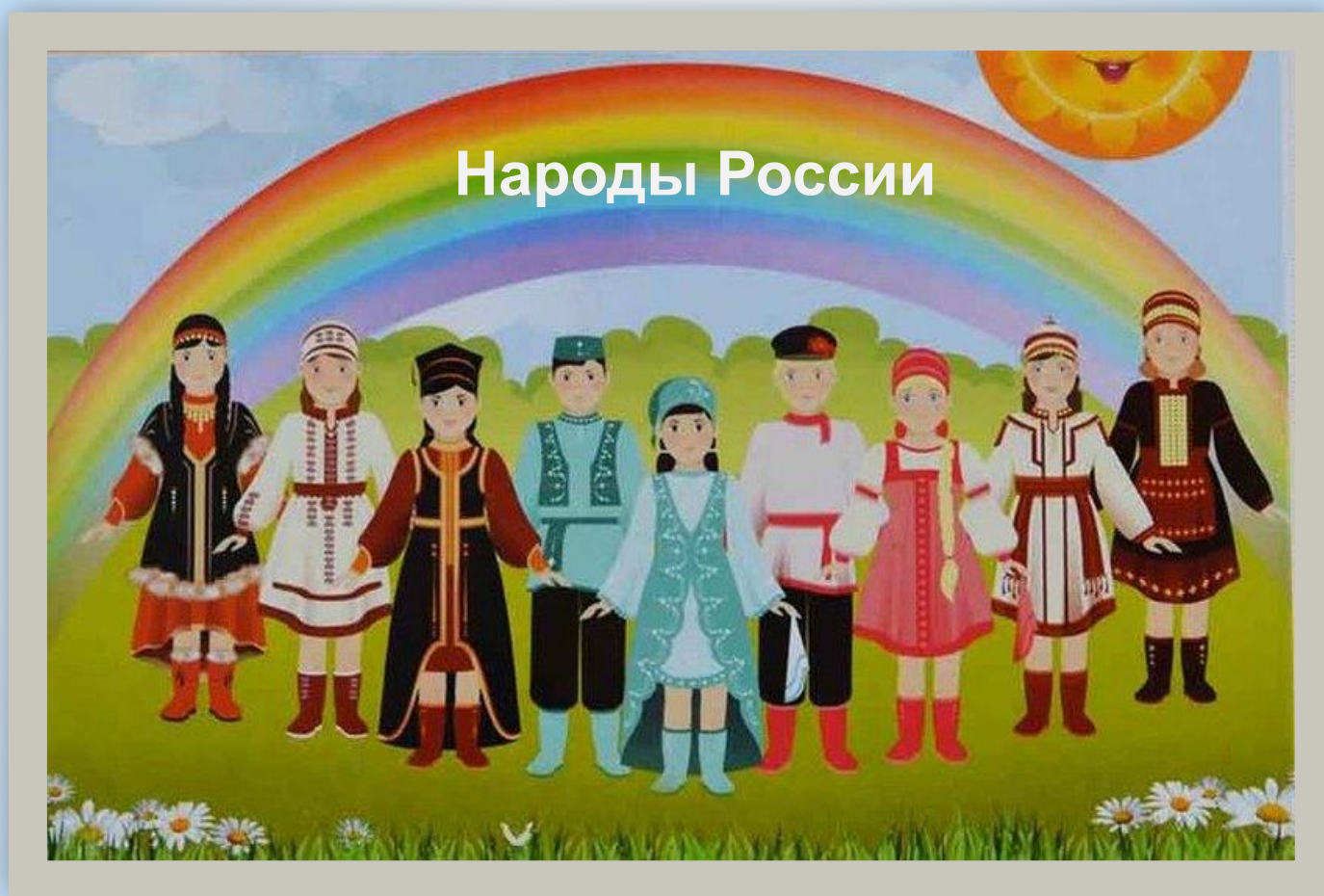
Альбом «Народы России»