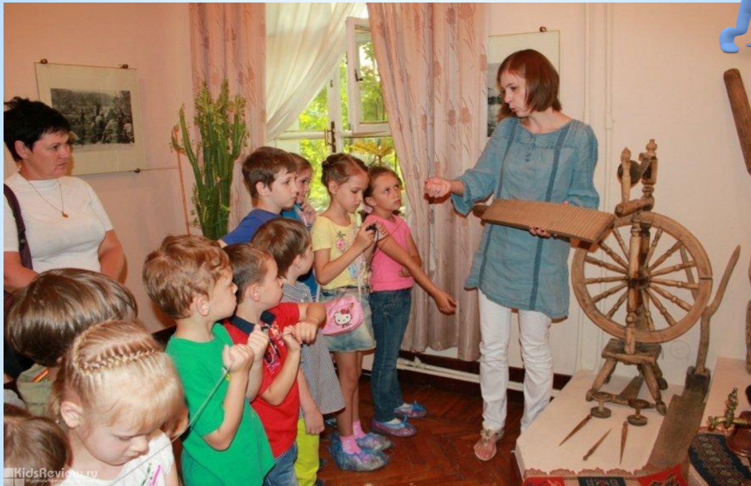
Совместное интерактивное занятие «Карта народов России»