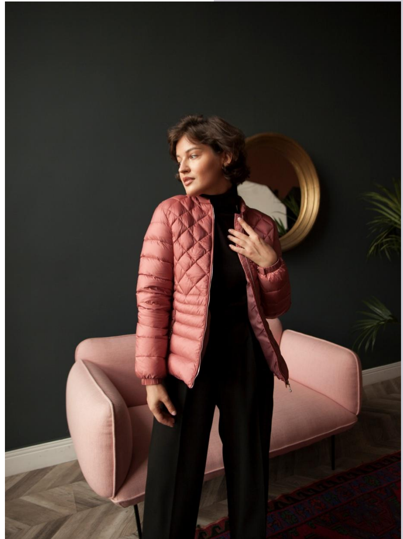
Women's outerwear collection WHITE OCEAN AW_20/221