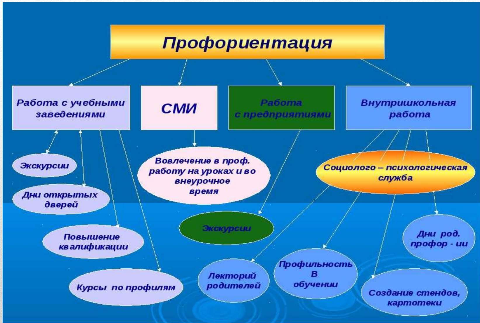
Система ранней профессиональной ориентации учащихся