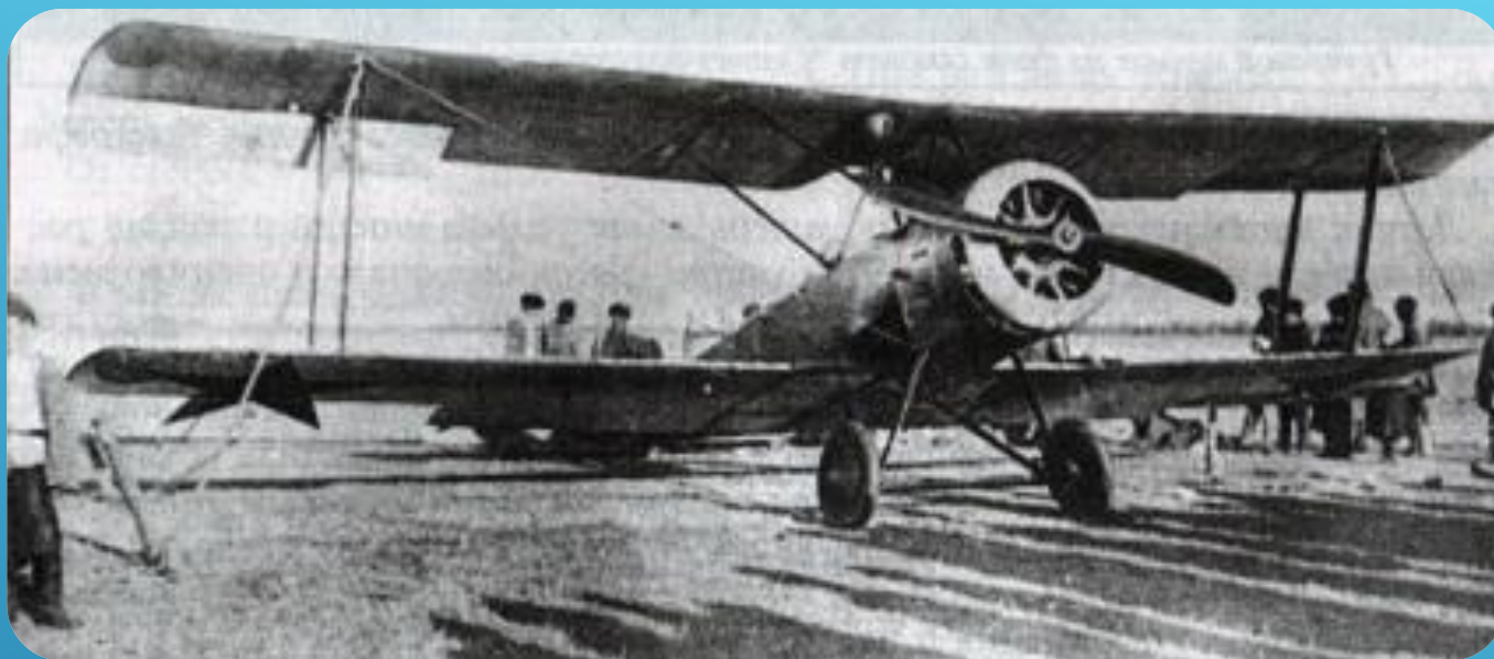
«СопВич» в Якутске на Зеленом лугу