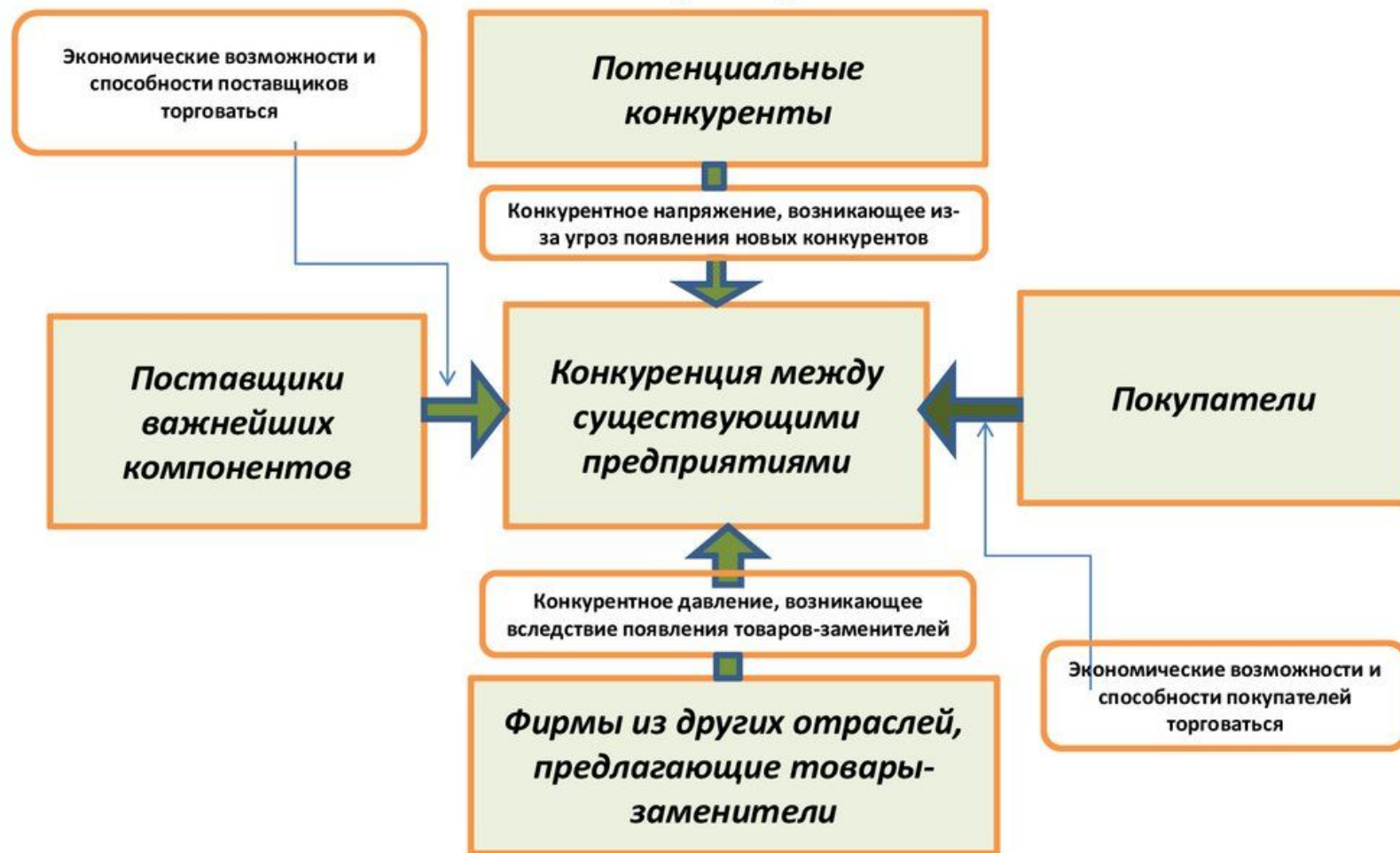
Модель основных конкурентных сил