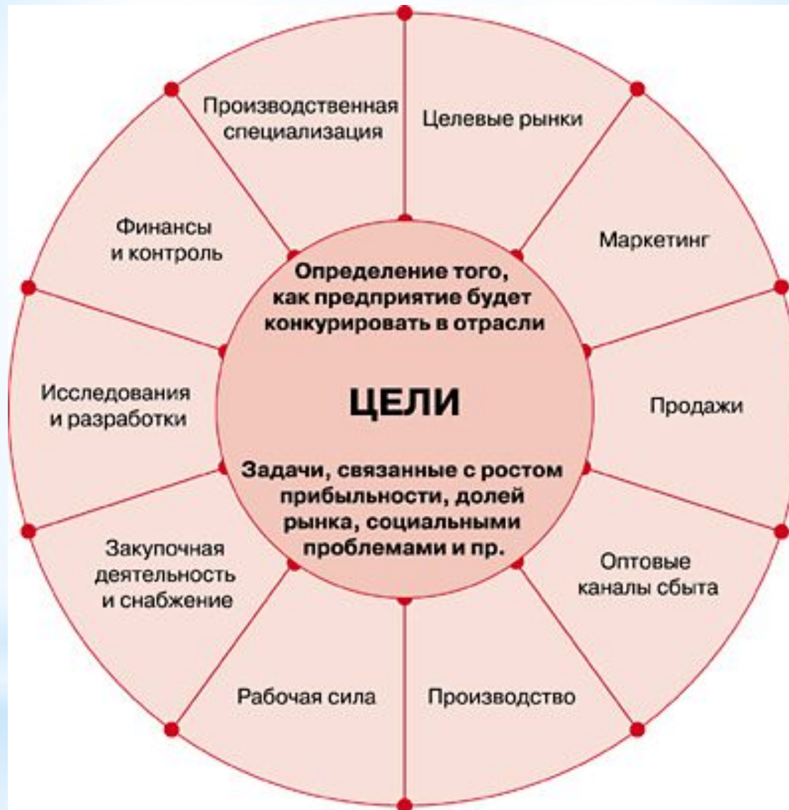
Колесо конкурентной стратегии