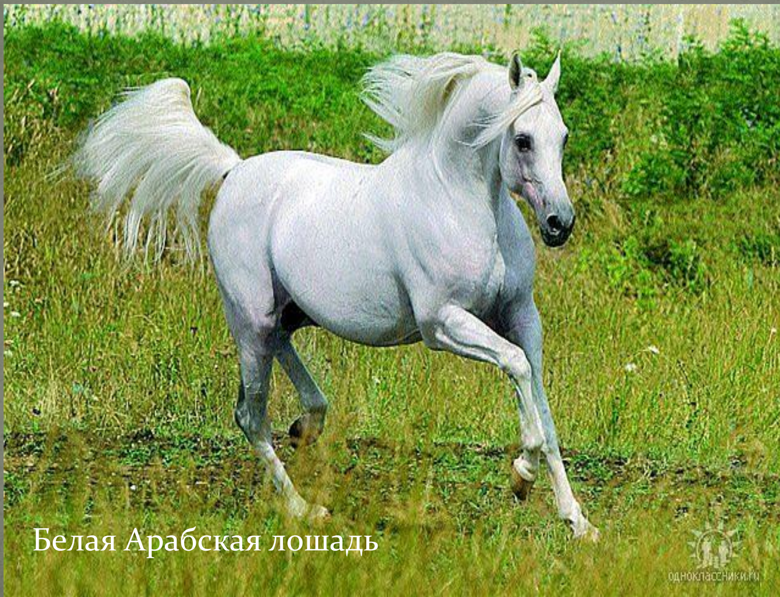
Белая Арабская лошадь