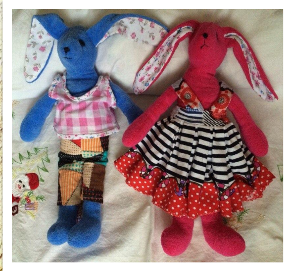
Работы Ирины Солодухиной