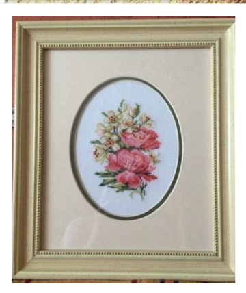
Работы Ирины Солодухиной