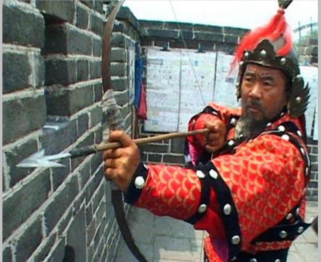
Лучник в Древнем Китае