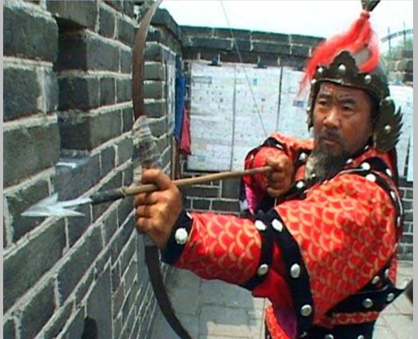
Лучник в Древнем Китае