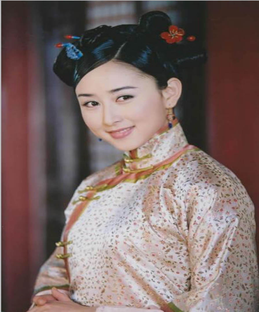
Китаянка в национальной одежде.