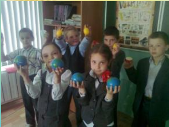
Шумовые инструменты, сделанные своими руками