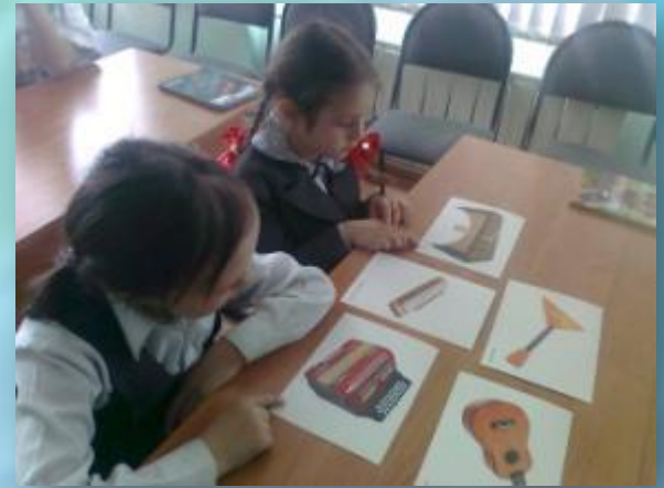
Карточки «Музыкальное лото».