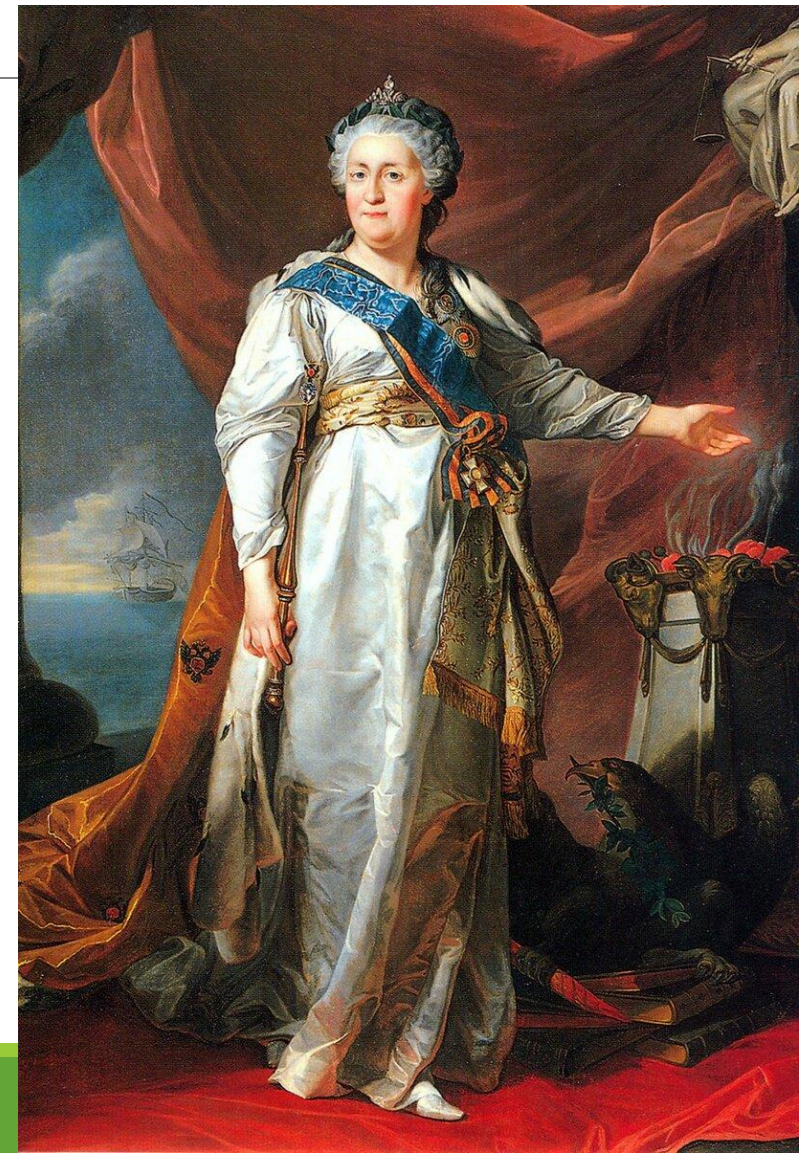
Екатерина II (Россия)