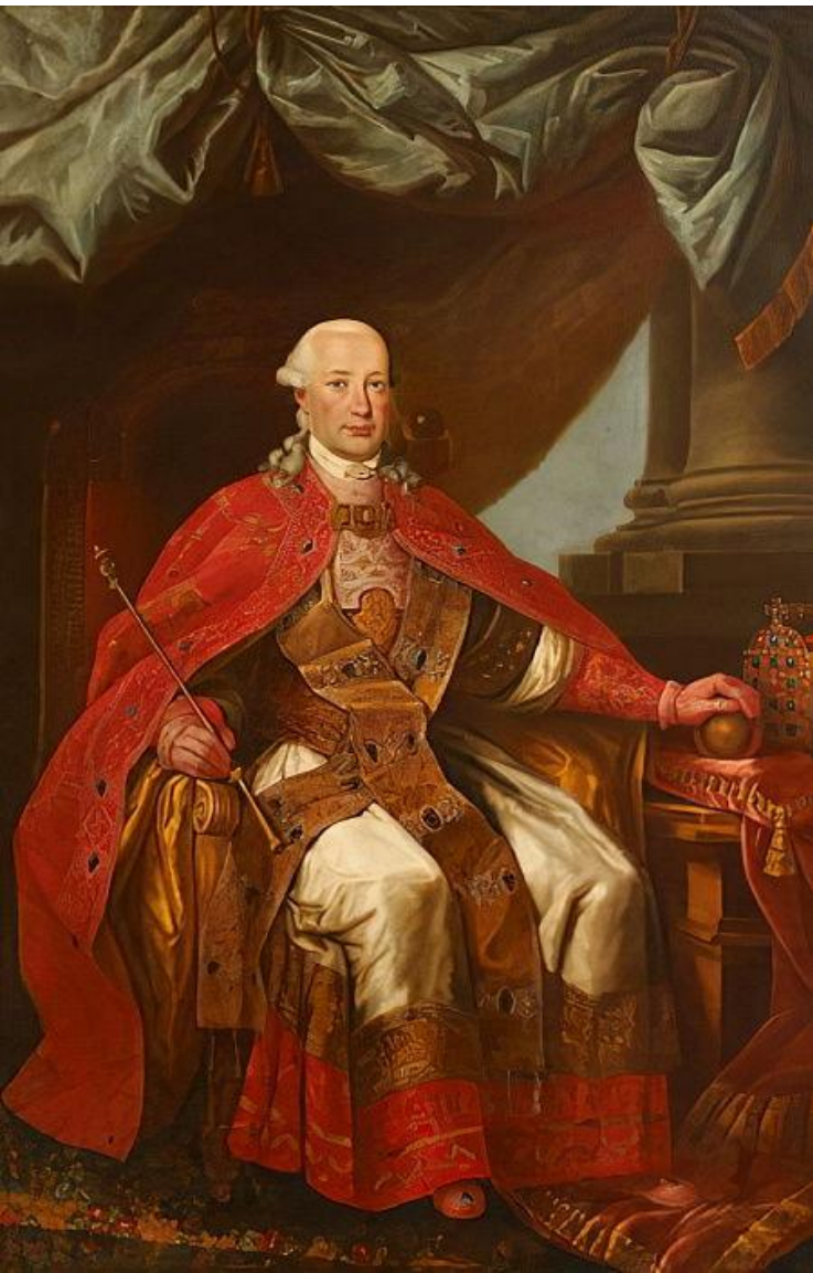
Леопольд II (Бельгия)