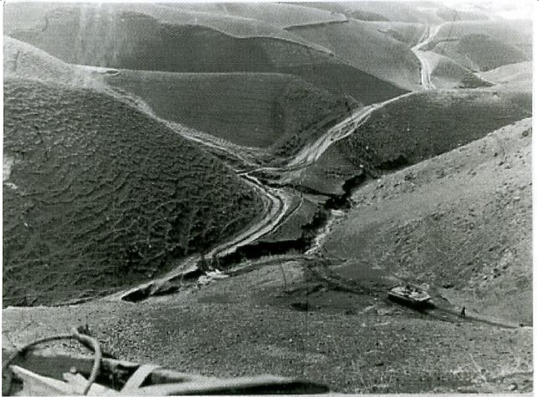
Горные дороги Гиндукуша летом