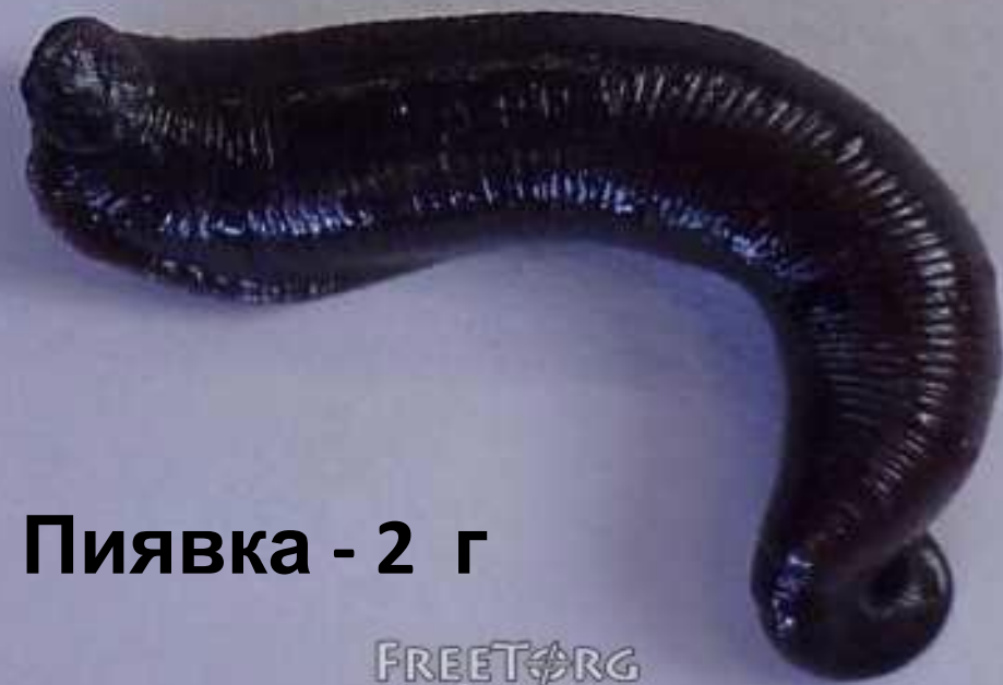
Пиявка - 2 г