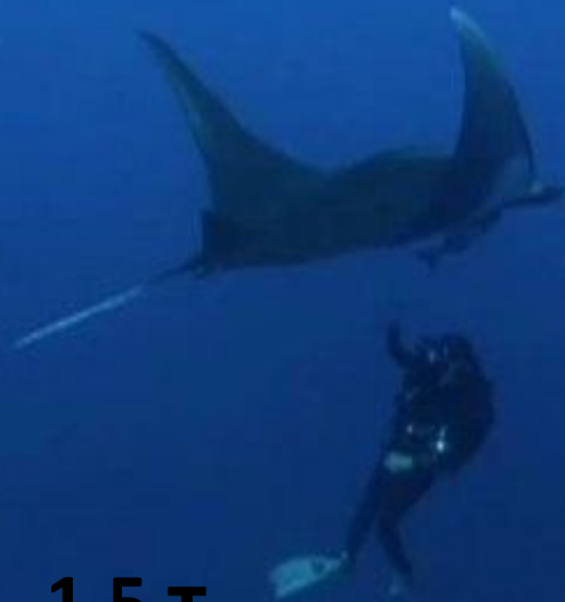
Скат морской дьявол (манта) – 1,5 т