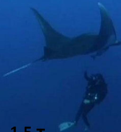
Скат морской дьявол (манта) – 1,5 т