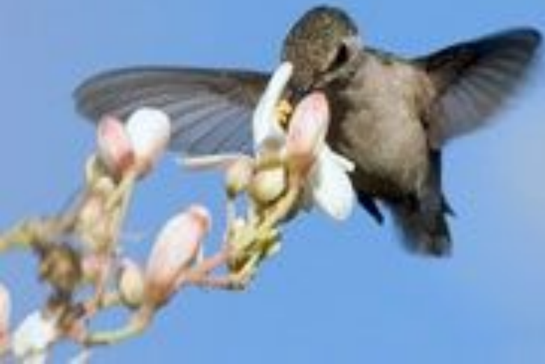
Колибри – 1,6 г