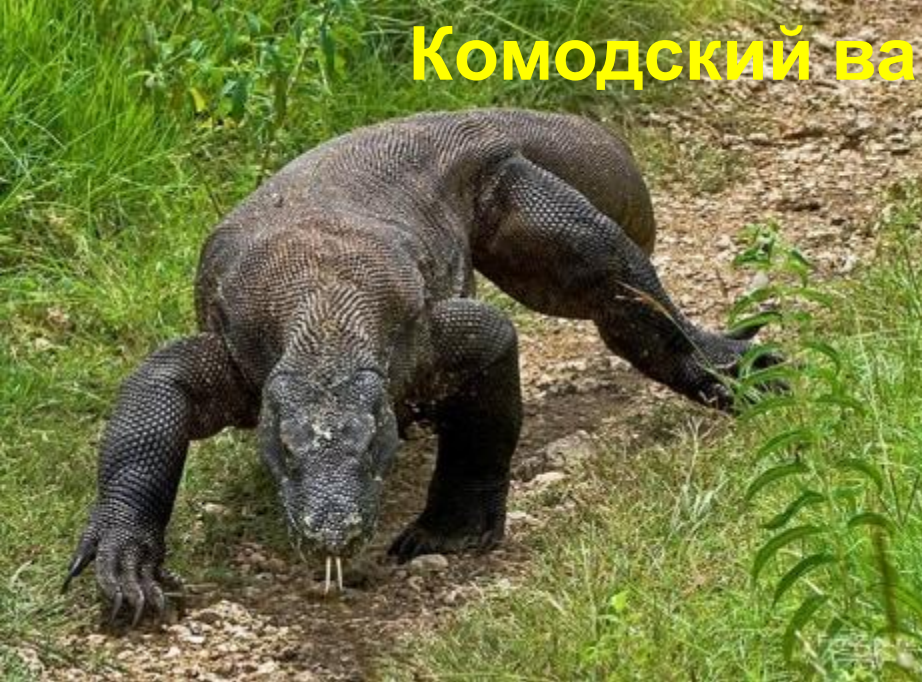
Комодский варан – 150 кг