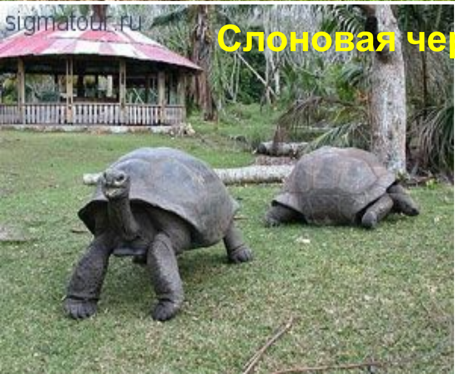
Слоновая черепаха – 200 кг