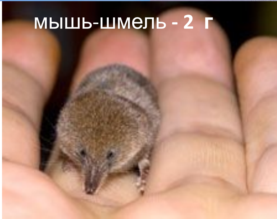
мышь-шмель - 2 г