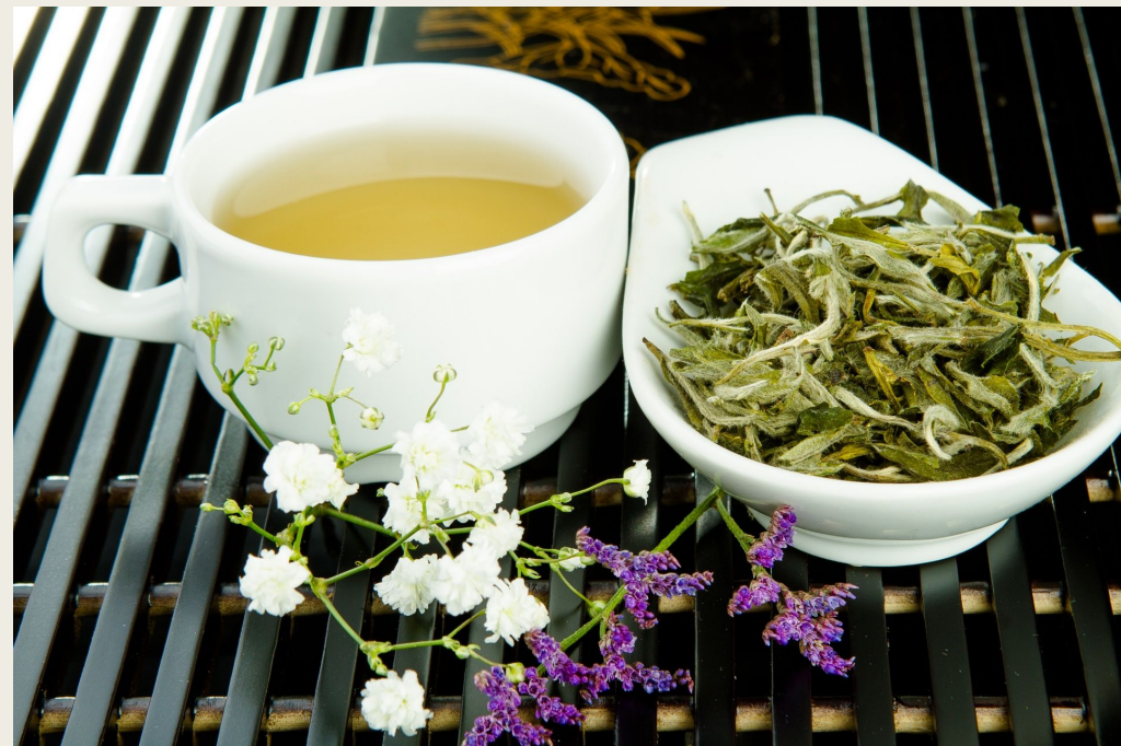
Вид белого чая - Белый Пион (Бай- Мудан)

Для элитных белых чаев собирается либо только один верхушечный листик (точнее, типса); либо типса плюс еще один следующий за ней листик. Производство подавляющего большинства сортов белого чая состоит только из двух шагов: Первый шаг – кратковременная выдержка на пару (своеобразное «прокаливание» около 1 мин, чтобы остановить процесс ферментации; хотя некоторые сорта белого чая иногда даже чуть-чуть ферментируют или подкапчивают на дыму), второй шаг – сушка (точнее, досушивание в духовках).