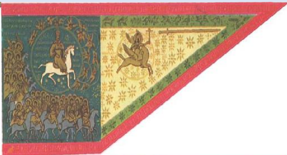
Великий Стяг Ивана IV 1560 год

С тех пор стяги с изображением лика Христа-Спасителя в качестве великокняжеских знамён получили большое распространение на Руси. Знамя становится своего рода походной иконой. Источники упоминают о молениях князей у знамени, которое освещалось митрополитом по чину святых икон. К XVI веку относятся первые дошедшие до нас русские знамёна: знамя «Всемиловнейшего Спаса» 1552 года, под которым Иван Грозный отправился на покорение Казани, и царский «Великий стяг» 1560 года, на котором изображён в виде всадника Михаил Архангел.