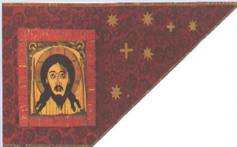
Стяг Всемиловнейшего Спаса 1552 год