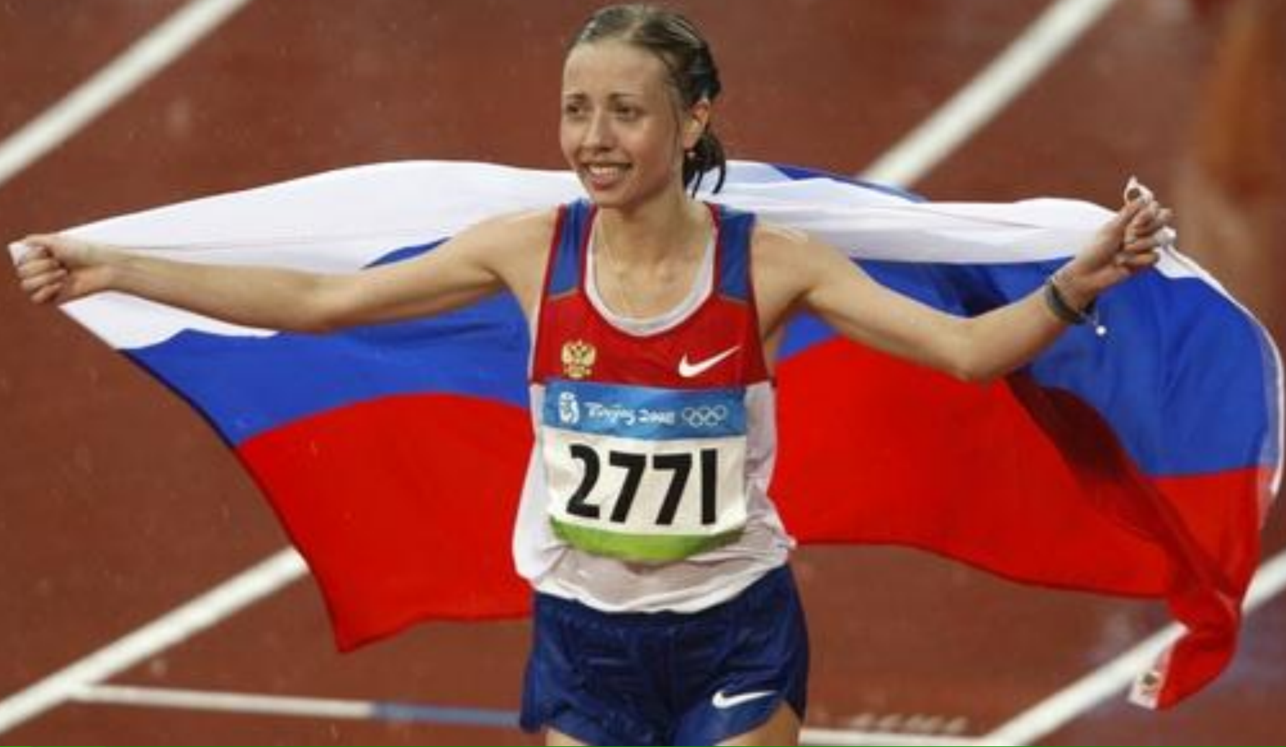
Пекин – 2008 г. На дистанции 20 км – олимпийская чемпионка Ольга Каниськина.