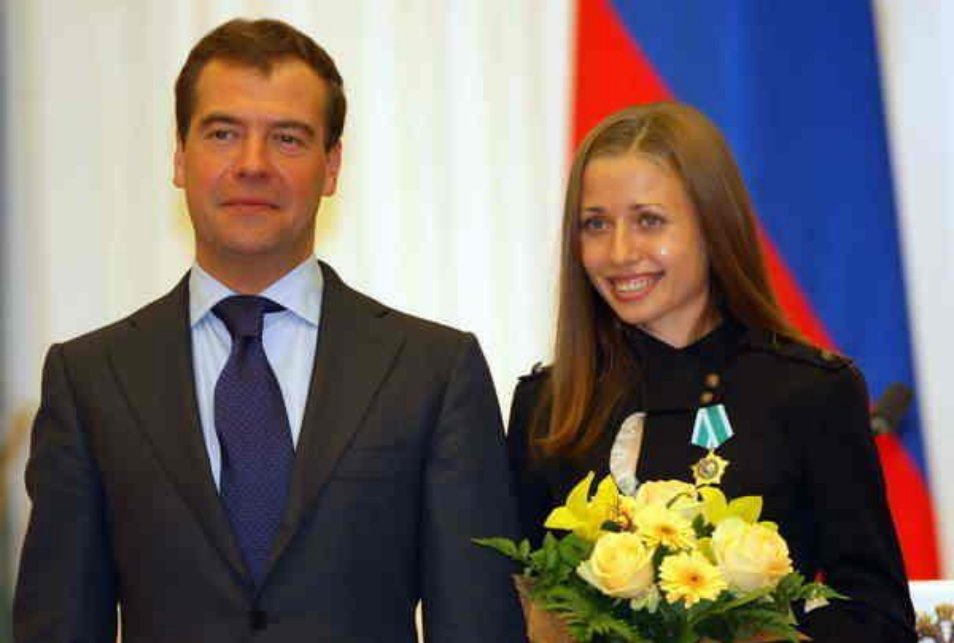
Президент России Д.А. Медведев, награждая О. Каниськину особо отметил её мастерство и волю к победе!