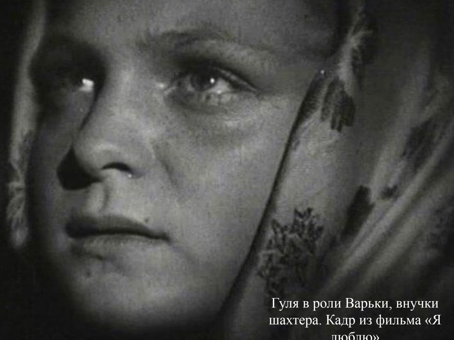
Гуля в роли Варьки, внучки шахтера. Кадр из фильма «Я люблю»