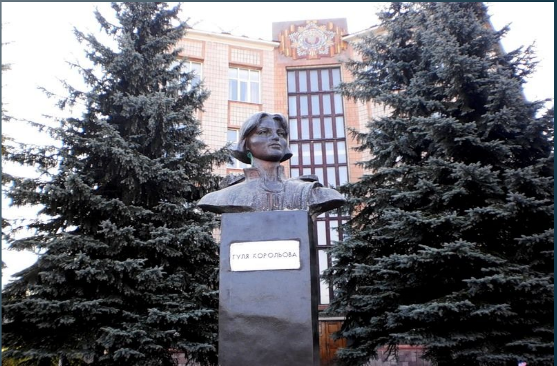
Памятник Гуле в городе Ровно рядом с Водным институтом народного хозяйства и природопользования