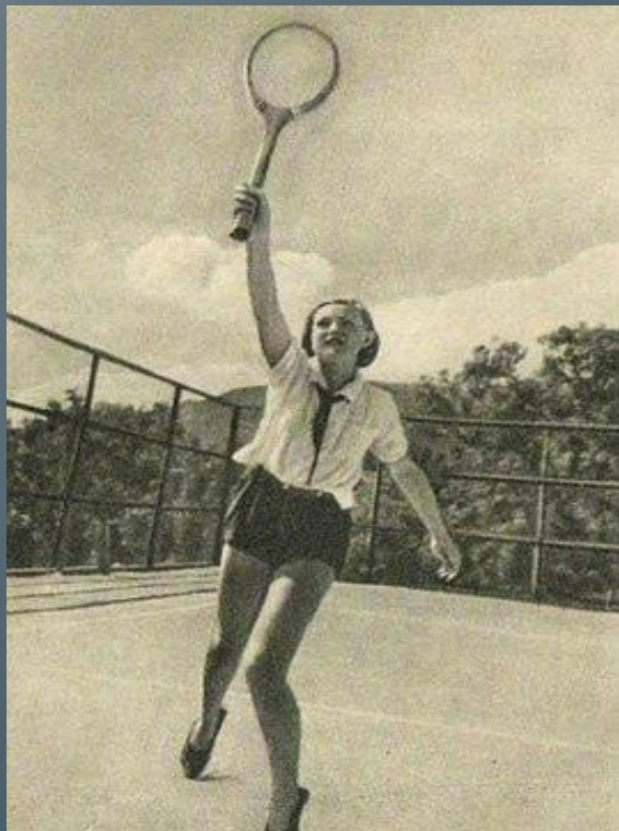
Гуля в «Артеке»