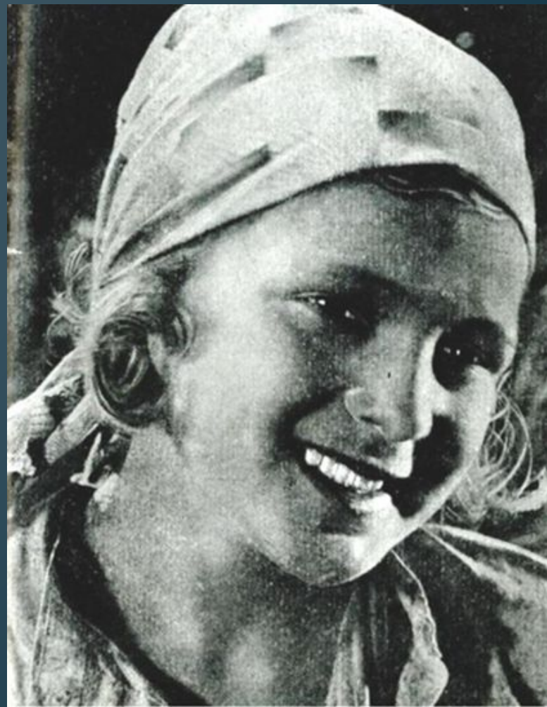
Гуля в роли Василинки. (Кадр из кинокартины «Дочь партизана»)

За роль в фильме «Дочь партизана» Гуля была награждена путевкой во Всесоюзный детский пионерлагерь «Артек». В ту смену были приглашены дети, добившиеся выдающихся успехов в своем деле.