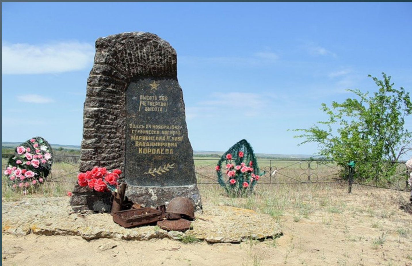
Памятник Гуле Королевой.

А может, для вечности Гуля Королёва останется и такой, какой ее сохранил нам в своих сердечных воспоминаниях ее школьный друг: «...Гуля собирает цветы в киевском Голосеевском саду. — Сегодня коллективный весенний прогул, — говорит она, обернувшись к ребятам. Потом весело бежит по полянке, а за ней вдогонку девчата и ребята. Какая-то ликующая она сегодня! Бурливая! Весенняя! Хорошо с ней!..»