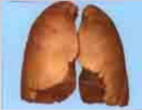
Лёгкое здорового человека