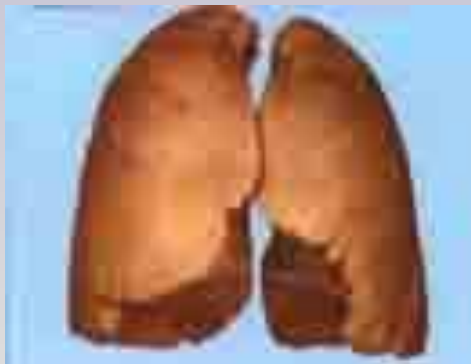
Лёгкое здорового человека