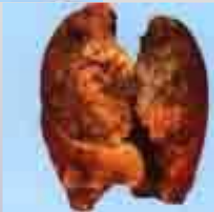
Лёгкое человека, больного хроническим бронхитом