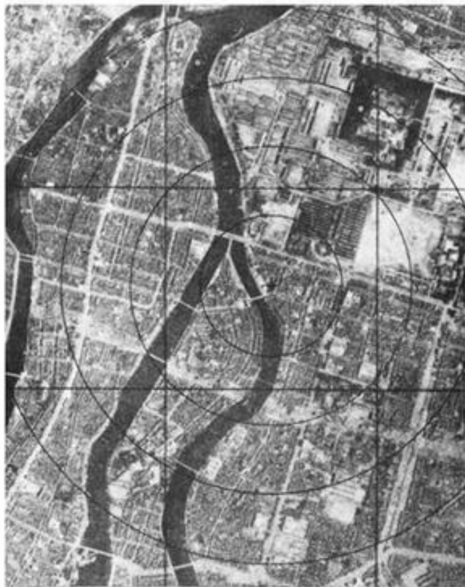
Хиросима до взрыва