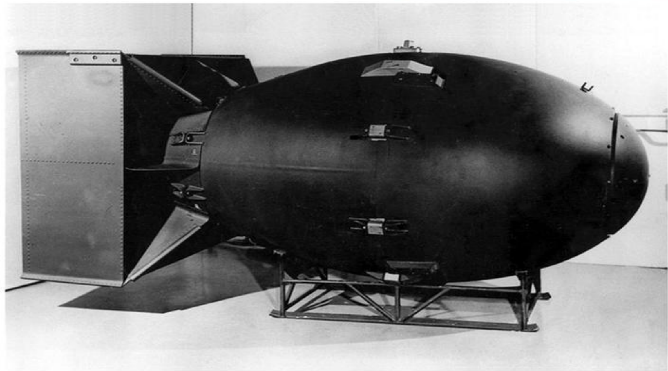
«Fat Man» («Толстяк»)