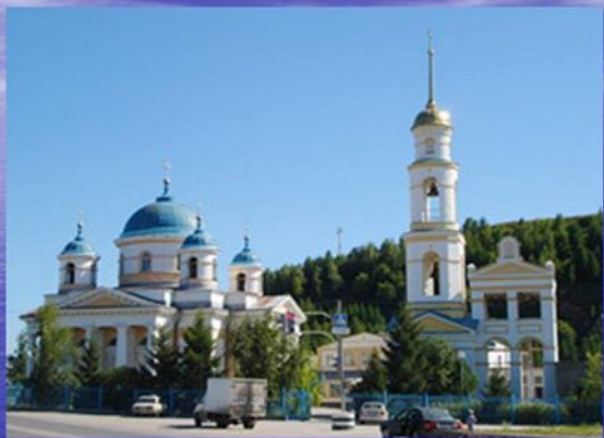
Христорождественская церковь у Царева кургана MySh