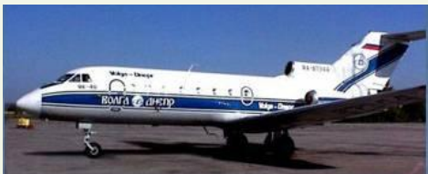
Як - 40