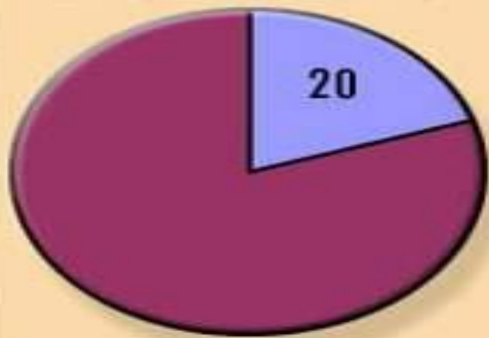
Доля Поволжья в общем производстве авиационных масел, %